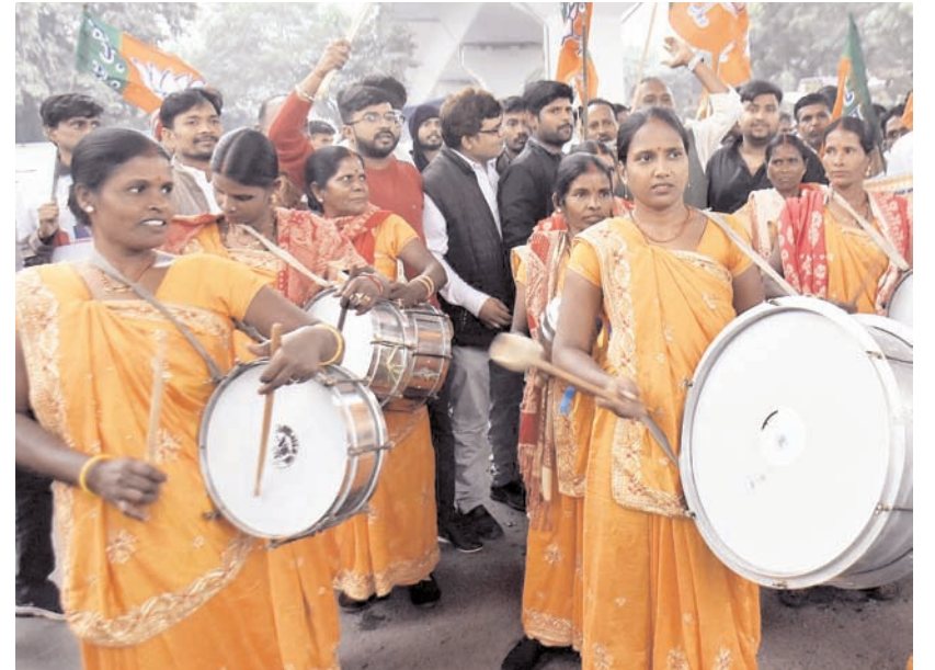
पटना में गुरुवार को अंबेडकर समागम के दौरान ढोल बजाते भाजपा समर्थक।