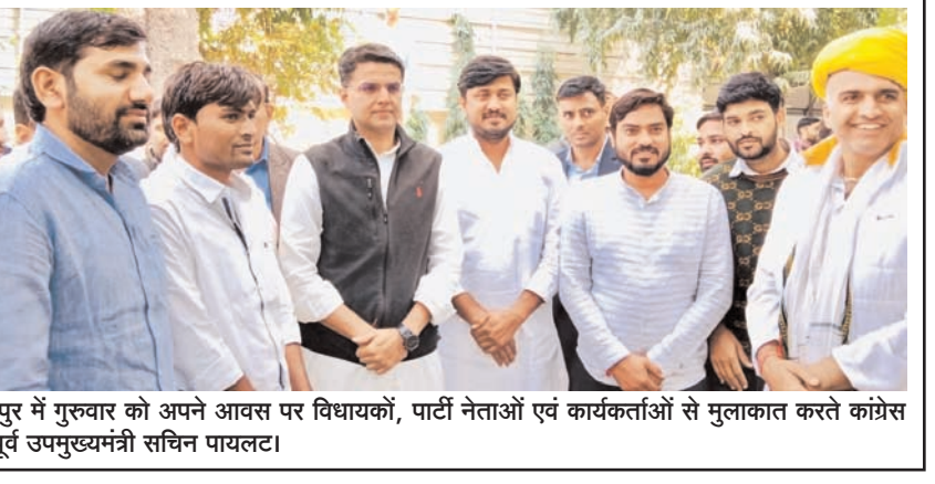
जयपुर में गुरुवार को अपने आवास पर विधायकों, पार्टी नेताओं एवं कार्यकर्ताओं से मुलाकात करते कांग्रेस के पूर्व उपमुख्यमंत्री सहिन पायलट।

कोटा। सीबीआई ने सैन्य दुर्ग अभियंता के कार्यालय कोटा में कार्यरत सहायक सैन्य दुर्ग अभियंता (एजीई/संविदा) को 1,10,000 रुपए की रिश्तत लेते गिरफ्तार किया है। आरोपी ने शिकायतकर्ता से लंबित बिलों को पास करने के लिए 1,50,000 रुपए एवं पूर्व की निविदाओं को बढ़ाने के लिए 10,000 रुपए की मांग थी। जानकारी के अनुसार सैन्य दुर्ग अभियंता कार्यालय, कोटा में कार्यरत एजीई (संविदा) लंबित बिलों को पास करने के लिए 1,50,000 रुपए एवं शिकायतकर्ता की पूर्व की निविदाओं को बढ़ाने के लिए 10,000 रुपए की मांग कर रहा था।