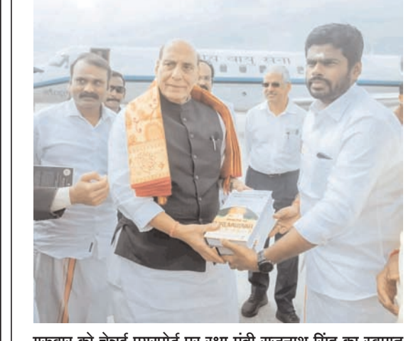
गुरुवार को चेन्नई एयरपोर्ट पर रक्षा मंत्री राजनाथ सिंह का स्वागत करते हुए भाजपा के प्रदेशाध्यक्ष के. अन्नामलाई।