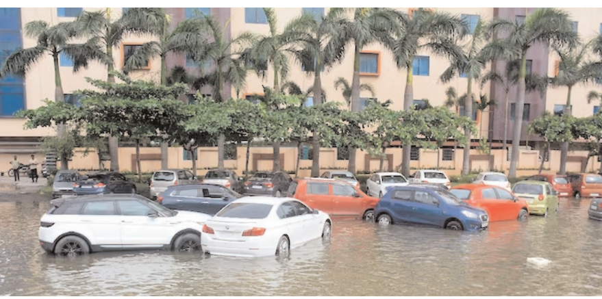
दक्षिण भारत राष्ट्रमत dakshinbharat.com

चेन्नई। क्षेत्रीय नियामक सहित भारतीय बीमा उद्योग, चक्रवात मिचौंग से प्रभावित पॉलिसीधारकों को संपत्ति और जीवन के नुकसान के दावे को प्राथमिकता देने के लिए उठाए जाने वाले कदमों के बारे में अजीब तरह से चुप है। चक्रवात मिचौंग के कारण, चेन्नई में भारी वर्षा हुई जिसके परिणामस्वरूप शहर में