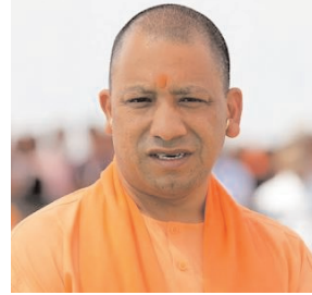
ऊर्जा जैसे सेक्टर में निवेश करने के लिए पूरी तरह से तैयार हैं। उन्होंने बताया कि जीबीसी के प्रथम फेज में सबसे बड़े निवेश के

में जुटी हुई है। फरवरी में हुए यूपी ग्लोबल इन्वेस्टर्स के बाद अब तक यूपी को 40 लाख करोड़ के निवेश प्रस्ताव प्राप्त हो चुके हैं। वहीं जीबीसी के पहले फेज में सरकार और उद्यमी 13 लाख करोड़ से अधिक के निवेश को धरातल पर उतारने के लिए तैयार हैं। प्रथम फेज में निवेश के मामले में जिन टॉप 10 कंपनियों की चर्चा हो रही है उनमें टाटा, हीराचंदानी, टस्को, ग्रीनको जैसे दिग्गजों के नाम शामिल हैं। ये कंपनियां प्रदेश के अंदर डेटा सेंटर, रिटेल मार्ट, स्किल डेवलपमेंट और