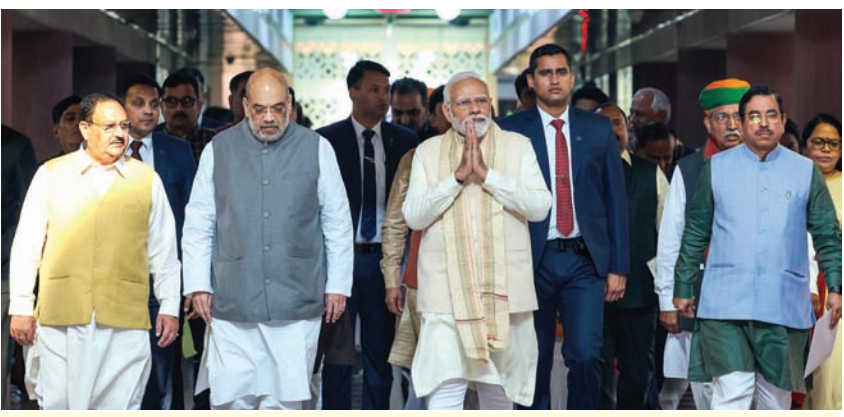
शासन के लिए भाजपा लोगों की सबसे परसंदीदा पार्टी बन गई है

नई दिल्ली/वाता। प्रधानमंत्री नरेन्द्र मोदी ने तीन राज्यों में भारतीय जनता पार्टी (भाजपा) की प्रचंड जीत को सभी कार्यकर्ताओं की सामूहिक जीत बताते हुए सभी भाजपा सांसदों का आह्वान किया कि वे 2024 के लोकसभा चुनावों के लिए जी जान से जुट जायें और सरकार की योजनाओं खासकर विश्वकर्मा योजना का प्रचार प्रसार करें।