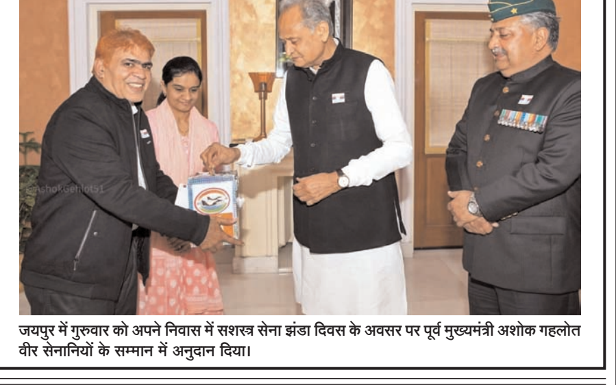
जयपुर में गुरुवार को अपने निवास में सशस्त्र सेना झंडा दिवस के अवसर पर पूर्व मुख्यमंत्री अशोक गहलोल वीर सेनानियों के सम्मान में अनुदान दिया।