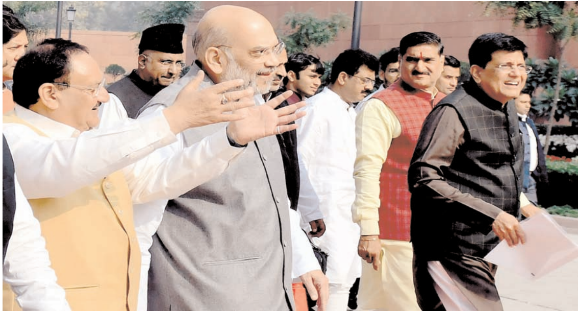
नई दिल्ली में भाजपा के राष्ट्रीय अध्यक्ष जेपी नड्डा, केन्द्रीय गृह मंत्री अमित शाह, केन्द्रीय मंत्री पीयूष गोयल और अन्य गुरुवार को भाजपा संसदीय दल की बैठक के बाद संसद पुस्तकालय भवन से बाहर आते हुए।