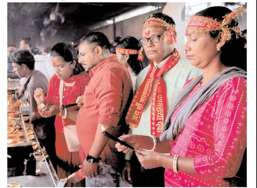
गुवाहाटी में शुकुवार को मां कामाख्या मंदिर में भक्तों ने दीये जलाते हुए।