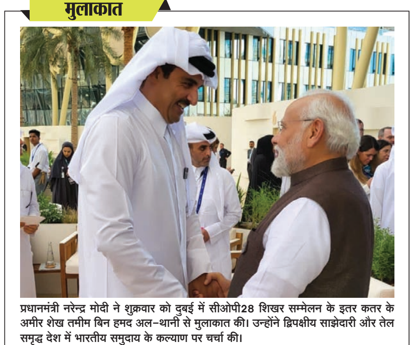
प्रधानमंत्री नरेंद्र मोदी ने शुक्रवार को दुबई में सीओपी28 शिखर सम्मेलन के इतर कतर के अमीर शेख तमीम बिन हमद अल-थानी से मुलाकात की। उन्होंने द्विपक्षीय साझेदारी और तेल समृद्ध देश में भारतीय समुदाय के कल्याण पर चर्चा की।

दक्षिण भारत राष्ट्रमत dakshinbharat.com अदालत में आरोपपत्र दायर किया। यह इस मामले में पूरक आरोप पत्र है क्योंकि एजेंसी पहले ऐसी लगभग पांच अभियोगन शिकायतें दायर कर चुकी है। इंडी ने 'आप' के राज्यसभा आबकारी नीति से जुड़े धनशोधन मामले में संजय सिंह के खिलाफ आरोपपत्र दायर किया। अधिकारियों ने यह जानकारी दी। इंडी ने धन शोधन निवारण अधिनियम (पीएमएलए) की विभिन्न धाराओं के तहत एक स्थानीय