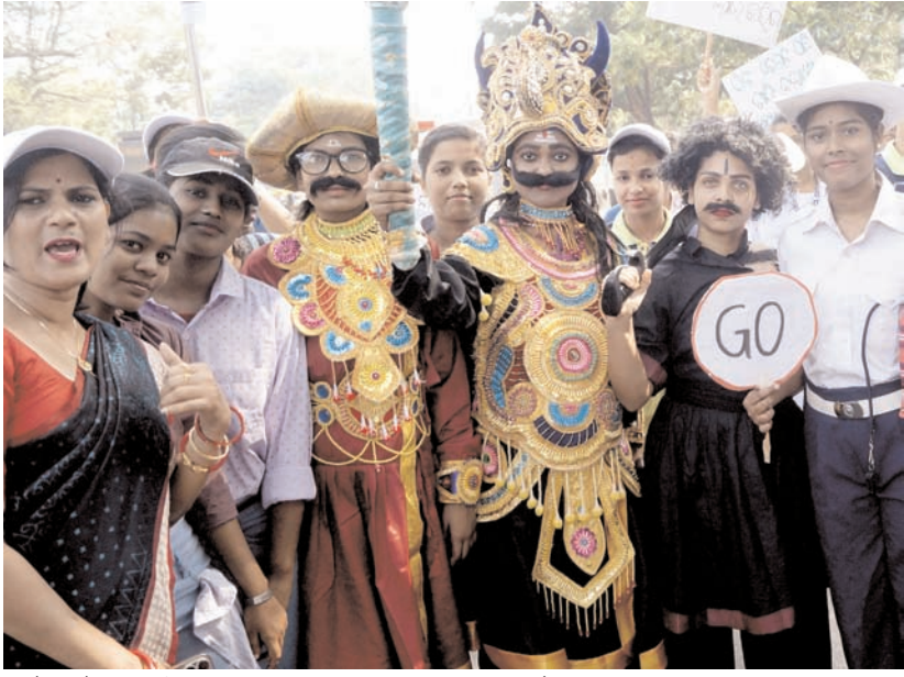
भुवनेश्वर में सरकारी नर्सिंग प्रशिक्षण एएनएम छात्र शनिवार को सड़क सुरक्षा जागरूकता अभियान पर मार्च निकाला।