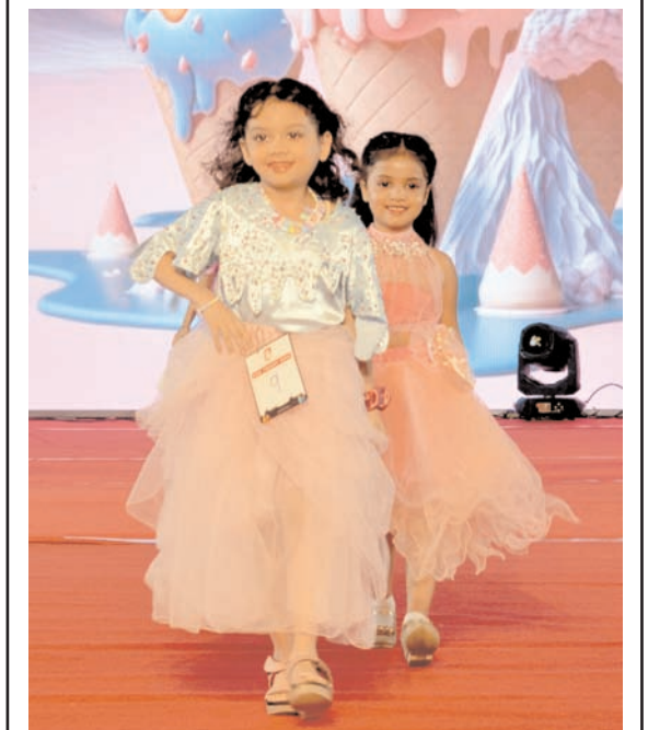
सुरत में शुक्रवार को एसजीसीसीआई गारमेट एक्सपो 2023 में बच्चे फैशन के नवीनतम रुझानों का प्रदर्शन करते बच्चे।

वर्णन करती है। जयशंकर इस समय रूस की पांच-दिवसीय आधिकारिक यात्रा पर आए हैं। जयशंकर ने 'एक्स' पर बृहस्पतिवार शाम को एक अन्य पोस्ट में कहा कि उन्होंने सेंट पीटर्सबर्ग के गवर्नर अलेक्जेंडर बेगलोव से मुलाकात की तथा भारत और रूस के बीच आर्थिक सहयोग और लोगों के बीच आदान-प्रदान को बढ़ावा देने के लिए दिए गए समर्थन की सराहना की। जयशंकर ने यहां पहुंचने से पहले राजधानी मॉस्को का दौरा किया जहां उन्होंने अपने रूसी समकक्ष सर्गेई लावरोव से मुलाकात की। उन्होंने राष्ट्रपति व्लादिमीर पुतिन और उप प्रधानमंत्री डेनिस मंतुरोव से भी मुलाकात की।