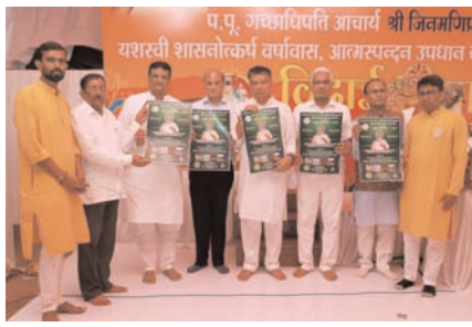
अवसर पर संघवी माणकचंद वरदीचंद ललवानी चैरिटेबल ट्रस्ट द्वारा प्रायोजित इस बहुसंगी कैलेंडर का प्रकाशन करवाया गया है जिसकी हजारों प्रतियां श्रद्धालुओं को पूरे देश में वितरित की जाएगी।