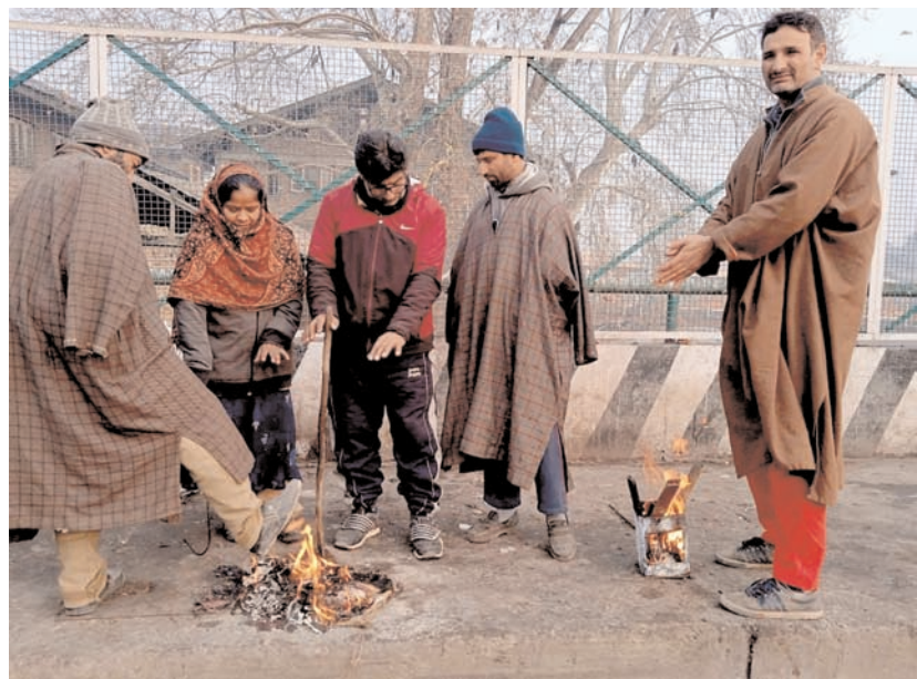
श्रीनगर में शुरुवार की ठंडी और कोहरे भरी सुबह में लोग अलाव का सहारा लेते हुए।