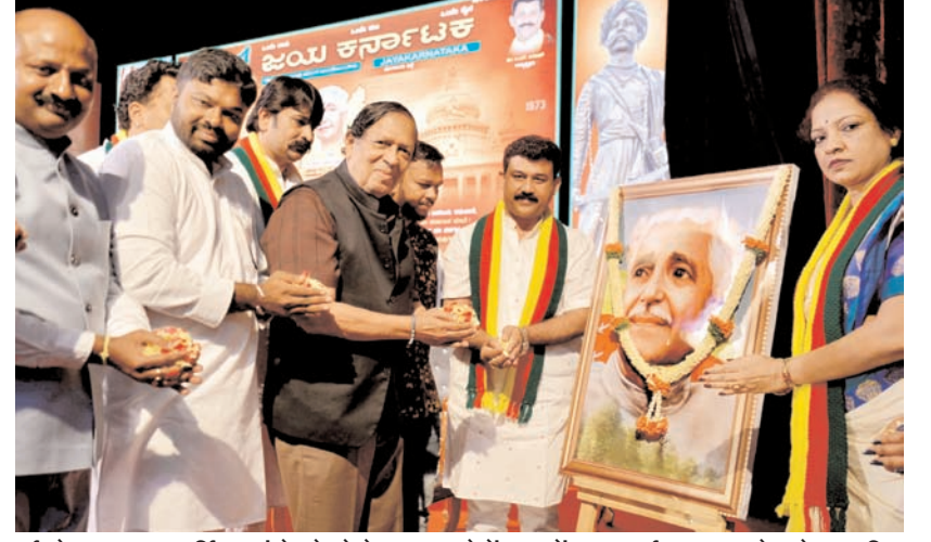
पूर्व लोकयुक्त न्यायमूर्ति एन संतोष हेगड़े ने शुक्रवार को बेंगलूर में जया कर्नाटक द्वारा कुवेम्पु के जन्मदिन के उपलक्ष्य में आयोजित विश्वमानव दिवस समारोह का उद्घाटन करते हुए।