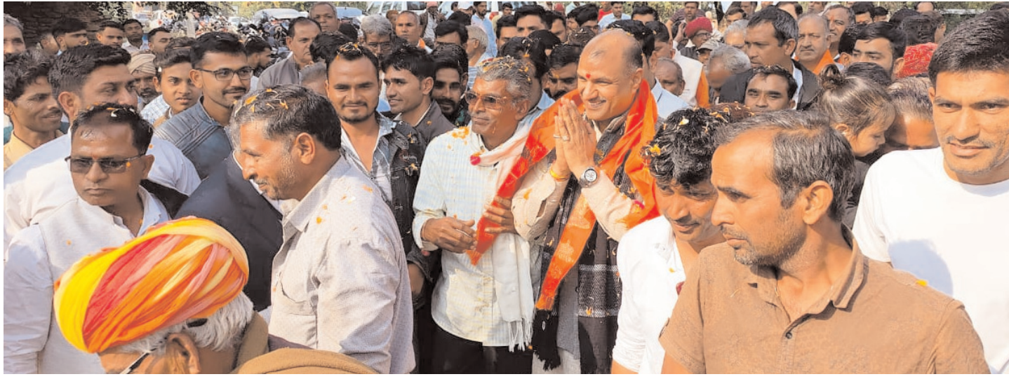
छोटी सादड़ी में शुक्रवार को भाजपा प्रदेश अध्यक्ष सीपी जोशी ने विकसित भारत संकल्प यात्रा कार्यक्रम में शामिल हुए और लाभार्थियों से संवाद किया।