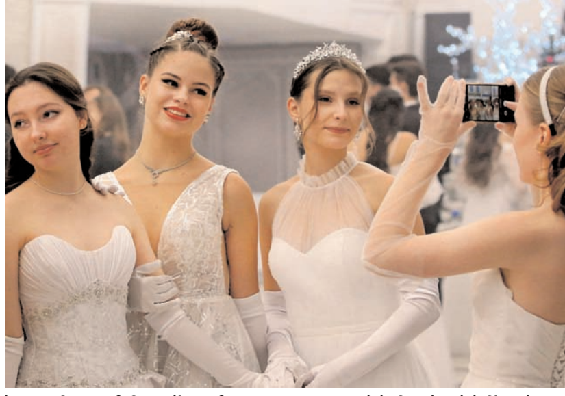
बेलारूस की राजधानी मिनस्क में आगामी नए साल का स्वागत करने के लिए लोग फोटो खिंचवाते हुए।