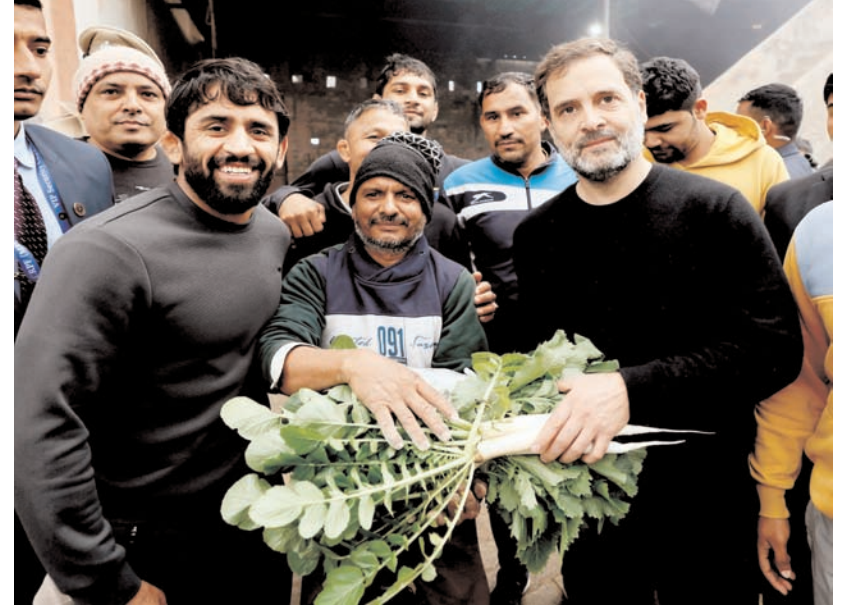
कांग्रेस नेता राहुल गांधी ने बुधवार को झरार में वीरेंद्र आर्य अखाड़े के वीर के दौरान ओलंपियन बजरंग पुनिया सहित पहलवानों से मुलाकात की।