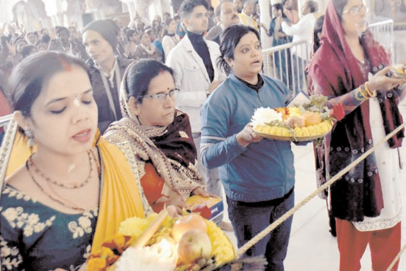
पटना में शनिवार को गीता जयंती समारोह के दौरान इस्कॉन मंदिर में पूजा करते श्रद्धालु।