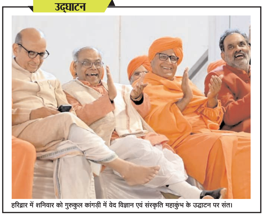
हरिद्वार में शनिवार को गुरुकुल कांगड़ी में वेद विज्ञान एवं संस्कृति महाकुंभ के उद्घाटन पर संत।

पेरिस अभियोजक कार्यालय ने एक बयान में कहा कि विशेष जांचकर्ता विमान में सवार सभी यात्रियों से पूछताछ कर रहे हैं और दो लोगों को आगे की जांच के लिए हिरासत में लिया गया है। मार्ने प्रीफेक्चर के अधिकारी ने बताया कि रोमानियाई कंपनी 'लीजेड एयरलाइंस' एक ए340 विमान बृहस्पतिवार को उतरने के बाद वैदी हवाई अड्डे पर खड़ा रहा।