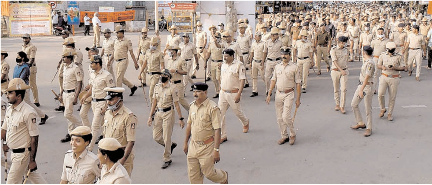
चिक्कमगलुरु में शनिवार को विहिप और बजरंगदल द्वारा आयोजित दत्तजयंती और दत्तमाला अभियान के दौरान सुरक्षा के तहत पुलिस ने रूट मार्च किया।