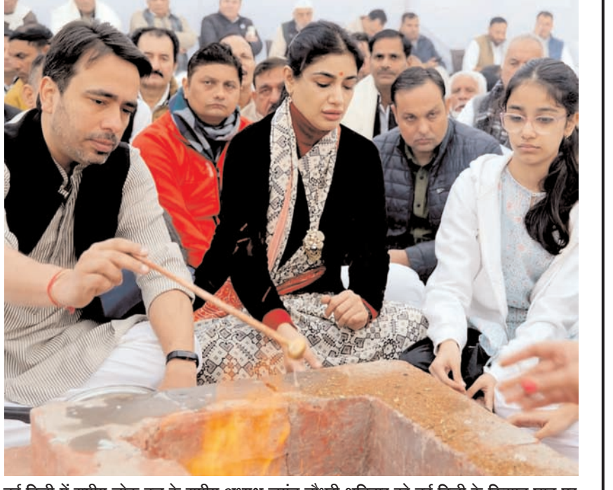
नई दिल्ली में राष्ट्रीय लोक दल के राष्ट्रीय अध्यक्ष जयंत चौधरी शनिवार को नई दिल्ली के किसान घाट पर पूर्व प्रधानमंत्री चौधरी चरण सिंह की जयंती के अवसर पर हवन-पूजन करते हुए।