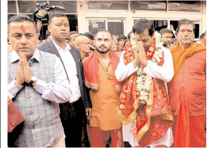
गुवाहाटी में केंद्रीय आयुष एवं जलमार्ग मंत्री सर्बानंद सनोवाल ने शनिवार को गुवाहाटी में मां कामाक्ष्या मंदिर में पूजा करते हुए।