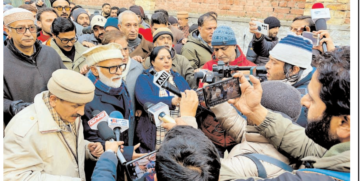
नेशनल कॉन्फ्रेंस के नेता और कार्यकर्ता शनिवार को जम्मू के पुंछ जिले में सेना के वाहनों पर घात लगाकर किए गए हमले में तीन नागरिकों की रहस्यमय मौत के खिलाफ विरोध प्रदर्शन करते हुए।