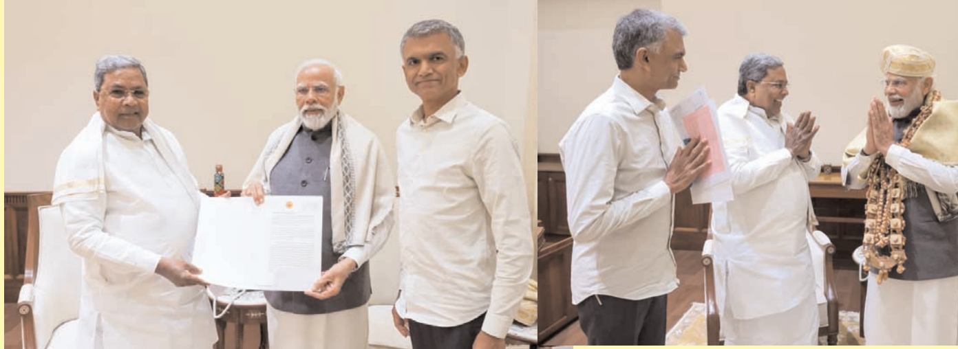
नई दिल्ली में कर्नाटक के मुख्यमंत्री सिद्धरामैया ने प्रधानमंत्री नरेंद्र मोदी से मुलाकात की। मुख्यमंत्री ने प्रधानमंत्री मोदी को मैसूर टोपी पहनाकर, शॉल ओढ़ाकर एवं चन्दन की माला पहनाकर स्वागत किया।

बंगलूर। कर्नाटक के मुख्यमंत्री सिद्धरामैया ने मंगलवार को नई दिल्ली में प्रधानमंत्री नरेंद्र मोदी से उनके कार्यालय में मुलाकात की और राज्य में सूखे की स्थिति से निपटने के लिए 18,177.44 करोड़ रुपये का मुआवजा पैकेज तलकावत जारी करने की मांग की। राज्य के राजस्व मंत्री कृष्णा बैरगौड़ा भी सिद्धरामैया के साथ थे। सिद्धरामैया ने मोदी को तीन पेज का पत्र सौंपा और केंद्र सरकार से सहायता मांगी। पत्र में लिखा है, कर्नाटक का एक बड़ा हिस्सा भयंकर सूखे का सामना कर रहा है। वर्ष 2020 के सूखा मैनुअल में निर्धारित प्रक्रिया के अनुसार, राज्य के 236 तालुकों में से 223 को सूखा प्रभावित घोषित किया गया है। 223 सूखा प्रभावित जिलों में से 196 गंभीर रूप से प्रभावित हैं। लगभग 48.19 लाख हेक्टेयर कृषि और बागवानी फसलों को 33 से 100 प्रतिशत तक नुकसान हुआ है। अधिकांश क्षेत्र में 80 प्रतिशत से अधिक नुकसान की सूचना है। छोटे और सीमांत किसान सबसे अधिक प्रभावित होते हैं, क्योंकि खेती के तहत लगभग 83 प्रतिशत भूमि छोटे और सीमांत कृषि जोत के अंतर्गत आती है। कर्नाटक ने फसलों को हटाने का आकलन किया है और एनडीआरएफ से 4,663.12 करोड़ रुपये की इन्पुट सब्सिडी मांगी है।