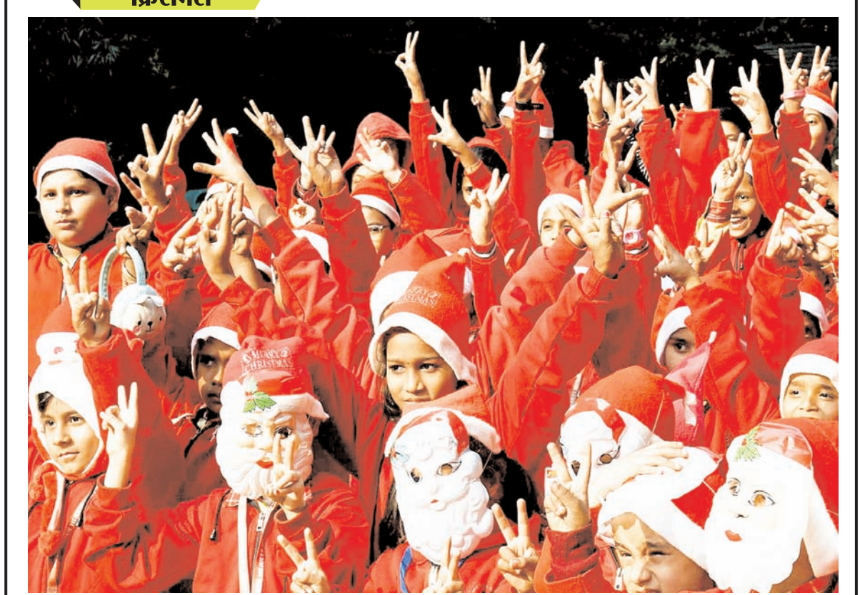
पटना में मंगलवार को पटना के संजय गांधी जैविक उद्यान में क्रिसमस समारोह के दौरान स्कूली बच्चे सांता क्लॉज के मुखौटे पहने हुए।