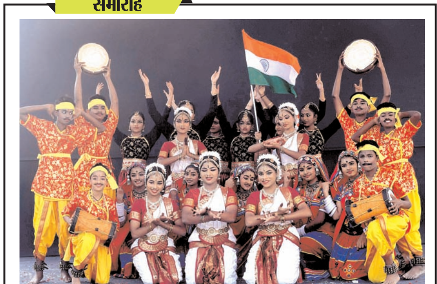
हैदराबाद में मंगलवार को हैदराबाद पब्लिक स्कूल के शताब्दी समारोह की झलक। इस अवसर पर राष्ट्रपति द्रौपदी मुर्मू भी उपस्थित रही।