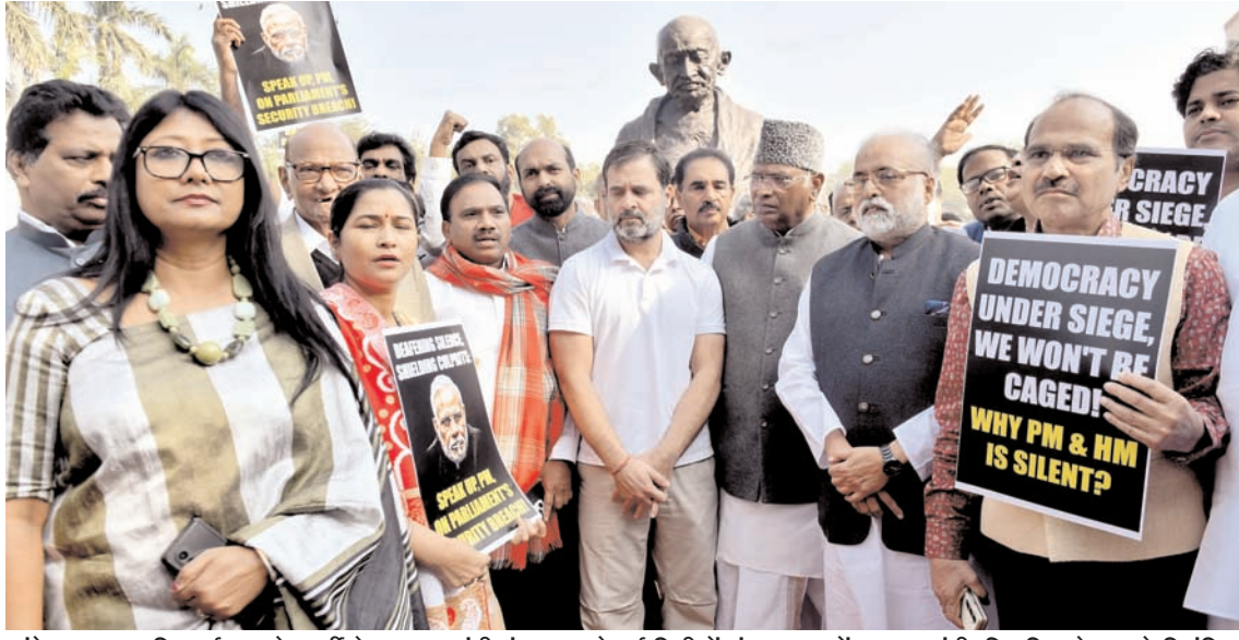
कांग्रेस अध्यक्ष मल्लिकार्जुन खरे, पार्टी नेता राहुल गांधी मंगलवार को नई दिल्ली में संसद भवन में महात्मा गांधी की प्रतिमा के सामने निलंबित सांसदों के साथ शामिल हुए।