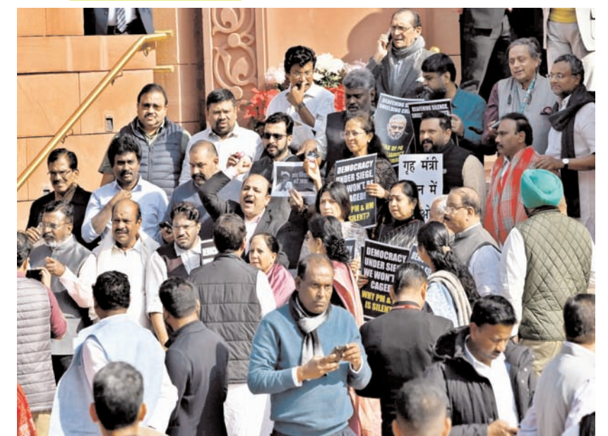
नई दिल्ली में मंगलवार को संसद भवन के मकर द्वार पर धरने पर बैठे निलंबित सांसद।