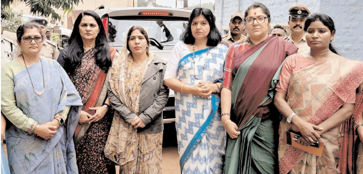
बेलगावी में भाजपा तथ्यान्वेषी समिति के सदस्यों ने शनिवार को बेलगावी में उत्पीड़न की शिकार आदिवासी महिलाओं से जानकारी लेने के लिए जिला अस्पताल में बेलगावी इंस्टीट्यूट ऑफ मेडिकल साइंस का दौरा किया।