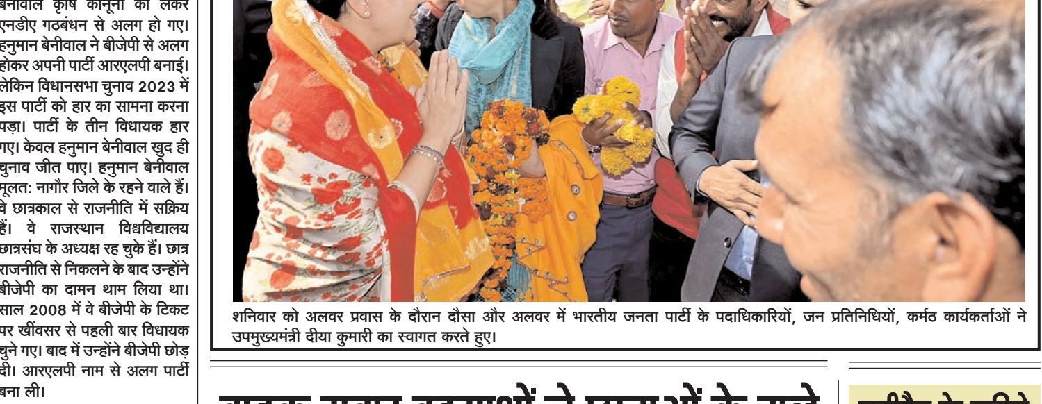
शनिवार को अलवर प्रवास के दौरान दौसा और अलवर में भारतीय जनता पार्टी के पदाधिकारियों, जन प्रतिनिधियों, कर्मठ कार्यकर्ताओं ने उपमुख्यमंत्री दीया कुमारी का स्वागत करते हुए।