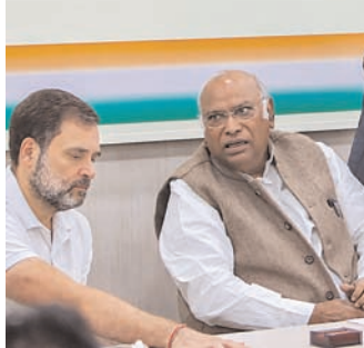
नई दिल्ली/भाषा। कांग्रेस के पूर्व अध्यक्ष राहुल गांधी ने शनिवार को कहा कि संसद की सुरक्षा में चूक की घटना के पीछे का कारण बेरोजगारी और महंगाई है।