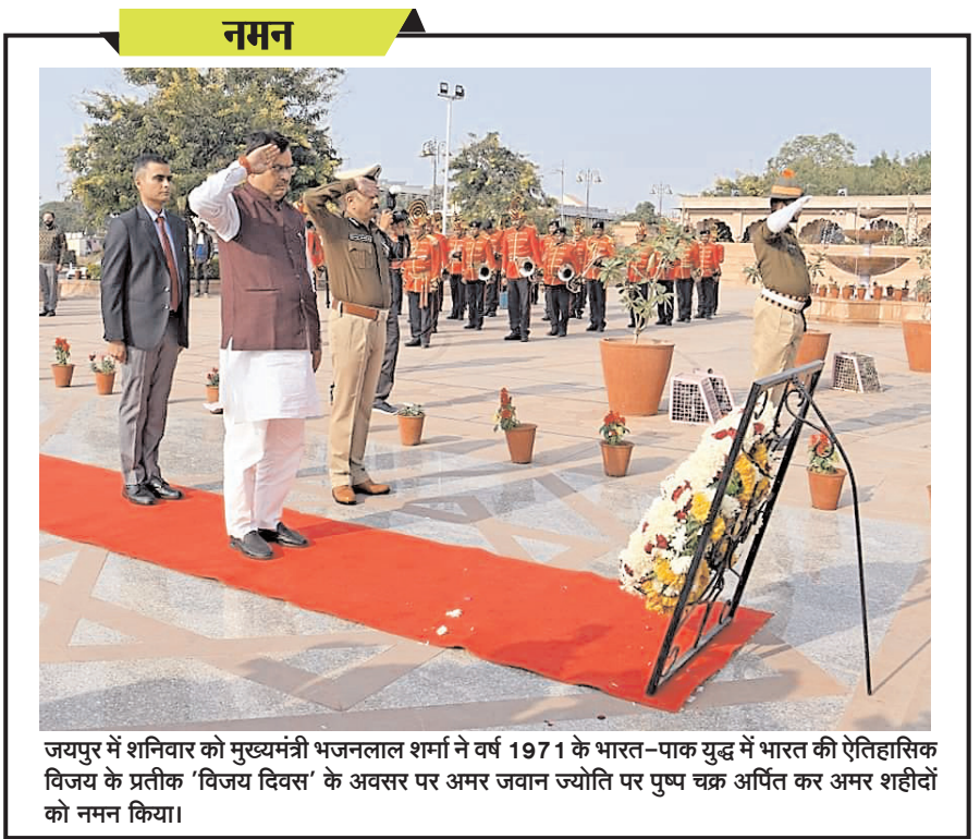
जयपुर में शनिवार को मुख्यमंत्री भजनलाल शर्मा ने वर्ष 1971 के भारत-पाक युद्ध में भारत की ऐतिहासिक विजय के प्रतीक 'विजय दिवस' के अवसर पर अमर जवान ज्योति पर पुष्प चक्र अर्पित कर अमर शहीदों को नमन किया।