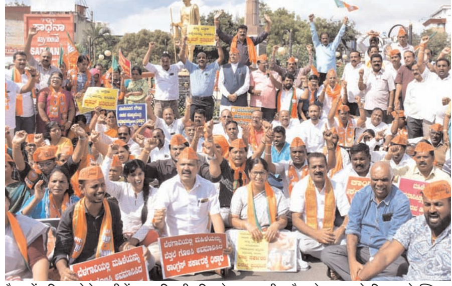
मैसूरु में शनिवार को बेलगावी में एक आदिवासी महिला के साथ मारपीट और उसे नग्न घुमाने की घटना के खिलाफ शनिवार को मैसूरु में भाजपा कार्यकर्ताओं ने विरोध प्रदर्शन किया