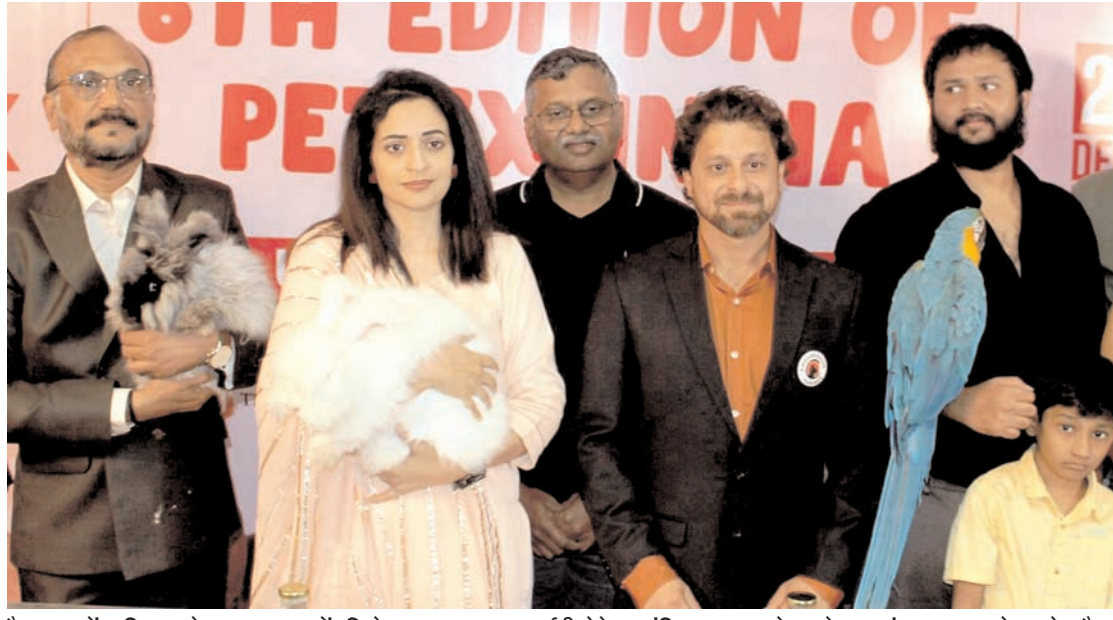
हेदराबाद में शनिवार को पालतू जानवरों की देखभाल पर एक प्रदर्शनी पेटेक्स इंडिया 2023 से पहले एक संवाददाता सम्मेलन के दौरान आयोजक और अन्य लोग जर्मन अंगोरा खरगोश, नीले और सुनहरे मकोय और अन्य जानवरों को ले जा रहे थे।