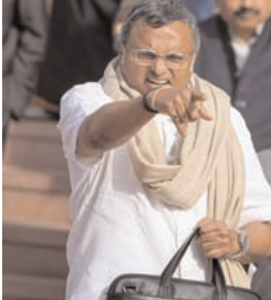
नई दिल्ली/भाषा। कांग्रेस नेता एवं सांसद कार्ति चिदंबरम ने 2011 में कुछ चीनी नागरिकों को वीजा जारी करने से जुड़े घनशोधन के मामले में उन्हें प्रवर्तन निदेशालय (ईडी) द्वारा जारी ताजा समन के संबंध में शनिवार को पेश होने से छूट मांगते हुए जांच को बेटुका बताया और कहा कि उन्हें दस्तावेज एकत्र करने के लिए समय चाहिए।

नई दिल्ली/भाषा। कांग्रेस नेता एवं सांसद कार्ति चिदंबरम ने 2011 में कुछ चीनी नागरिकों को वीजा जारी करने से जुड़े घनशोधन के मामले में उन्हें प्रवर्तन निदेशालय (ईडी) द्वारा जारी ताजा समन के संबंध में शनिवार को पेश होने से छूट मांगते हुए जांच को बेटुका बताया और कहा कि उन्हें दस्तावेज एकत्र करने के लिए समय चाहिए। इससे पहले संघीय एजेंसी ने तमिलनाडु की शिवगंगा सीट से 52 वर्षीय सांसद को दिल्ली में 12 दिसंबर को मामले के जांच अधिकारी के समक्ष पेश होने को कहा था। सांसद ने संसद सत्र में व्यस्त होने को प्रवर्तन निदेशालय का 2022 का यह मामला इन्हें आरोपों से जुड़ा है। कार्ति ने अपने वकील के माध्यम से मामले के जांच अधिकारी को अपना चुनावी हलफनामा, आयकर रिटर्न, बैंक खातों और अचल संपत्ति का विवरण संलग्न करते हुए लगभग 100 पन्नों का जवाब भेजा है और उन्होंने शनिवार को पेश होने से छूट और एजेंसी द्वारा मांगे गए सभी दस्तावेज एकत्र करने के लिए समय मांगा है।