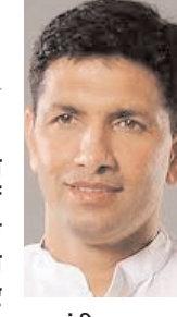
नई दिल्ली/भाषा। कांग्रेस ने हालिया विधानसभा चुनाव में हार के बाद अपनी मध्य प्रदेश इकाई में बड़ा बदलाव करते हुए शनिवार को पूर्व मुख्यमंत्री कमलनाथ के स्थान पर पूर्व मंत्री जीतू पटवारी को राज्य इकाई के अध्यक्ष नियुक्त किया।