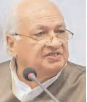
राज्यपाल ने कहा, राजनीतिक दल ने आधिकारिक तौर पर एक बयान जारी करके कहा है कि काला झंडा जारी रहेगा, लेकिन कोई रुकावट नहीं होगी।