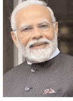
नई दिल्ली/भाषा। प्रधानमंत्री नरेन्द्र मोदी विकास की विभिन्न परियोजनाओं की शुरुआत करने के लिये 17 और 18 दिसंबर को सूत एवं वाराणसी जायेंगे।

नई दिल्ली/भाषा। प्रधानमंत्री नरेन्द्र मोदी विकास की विभिन्न परियोजनाओं की शुरुआत करने के लिये 17 और 18 दिसंबर को सूत एवं वाराणसी जायेंगे। प्रधानमंत्री कार्यालय की ओर से जारी बयान में इसकी जानकारी दी गयी है। बयान में कहा गया है कि मोदी 'विकसित भारत संकल्प यात्रा' में भाग लेने के लिए वाराणसी जाने से पहले रविवार को सूत उड़ान में शामिल होंगे। सूत उड़ान में एक नए एकीकृत टर्मिनल भवन का उद्घाटन करेंगे। बयान में कहा गया है कि रविवार शाम वह नमो घाट पर 'काशी तमिल संगम-2023' का उद्घाटन करेंगे। वाराणसी में अगले दिन वह एक सार्वजनिक समारोह में स्वयं महामंदिर का उद्घाटन करेंगे और 'विकसित भारत संकल्प यात्रा' में भी भाग लेंगे। इसमें कहा गया है कि प्रधानमंत्री अपने संसदीय क्षेत्र में 19,150 करोड़ रुपये से अधिक की कई विकास परियोजनाओं का उद्घाटन एवं शिलान्यास करेंगे।