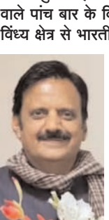
उज्जैन दक्षिण से विधायक मोहन यादव ने बुधवार को यहां लाल परेड ग्राउंड में एक भव्य समारोह में मध्य प्रदेश के नए मुख्यमंत्री के रूप में शपथ ली।

भोपाल/दक्षिण भारत। मध्य प्रदेश के नवनिर्वाचित उपमुख्यमंत्री राजेंद्र शुक्ला इंजीनियरिंग पृष्ठभूमि वाले पांच बार के विधायक हैं। वह विंध्य क्षेत्र से भारतीय जनता पार्टी (भाजपा) के एक प्रमुख