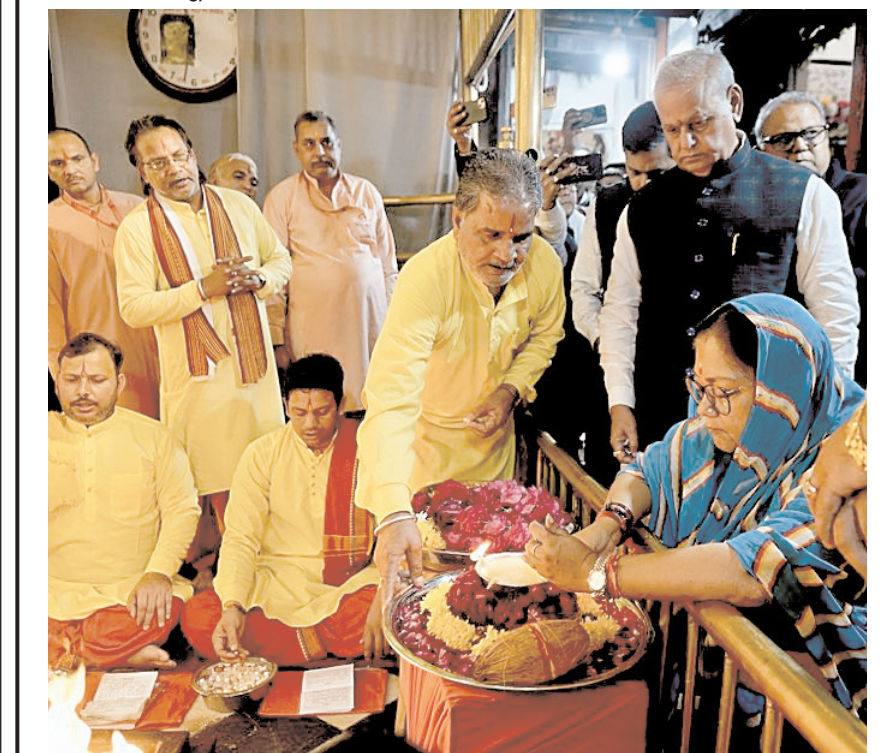
शनिवार को दौसा स्थित मेहेदीपुर बालाजी महाराज के दर्शन कर पूजा-अर्चना करती पूर्व मुख्यमंत्री वसुंधरा राजे।