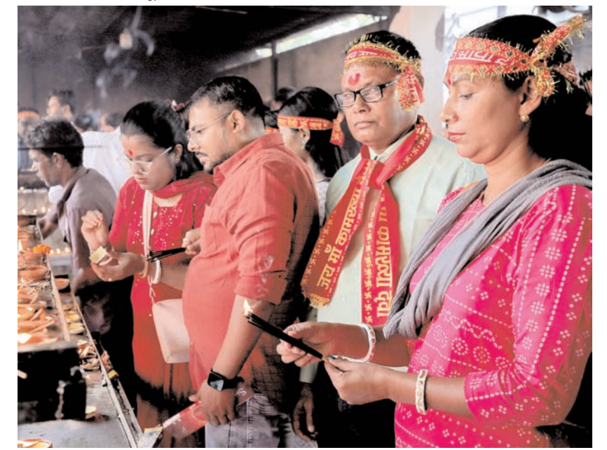
गुवाहाटी में शुक्रवार को मां कामाख्या मंदिर में भक्तों ने दीये जलाते हुए।