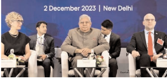
2 December 2023 | New Delhi

नई दिल्ली/भाषा। संसद के शीतकालीन सत्र से पहले राज्यसभा के सभापति जगदीप धनखड़ ने शनिवार को विधायिका के सभी सदस्यों से देश की संविधान सभा में देखे गए व्यवहार का पालन करने का आग्रह किया, जिसके तीन साल के कार्यकाल के दौरान देशभर भी व्यवधान नहीं हुआ था।