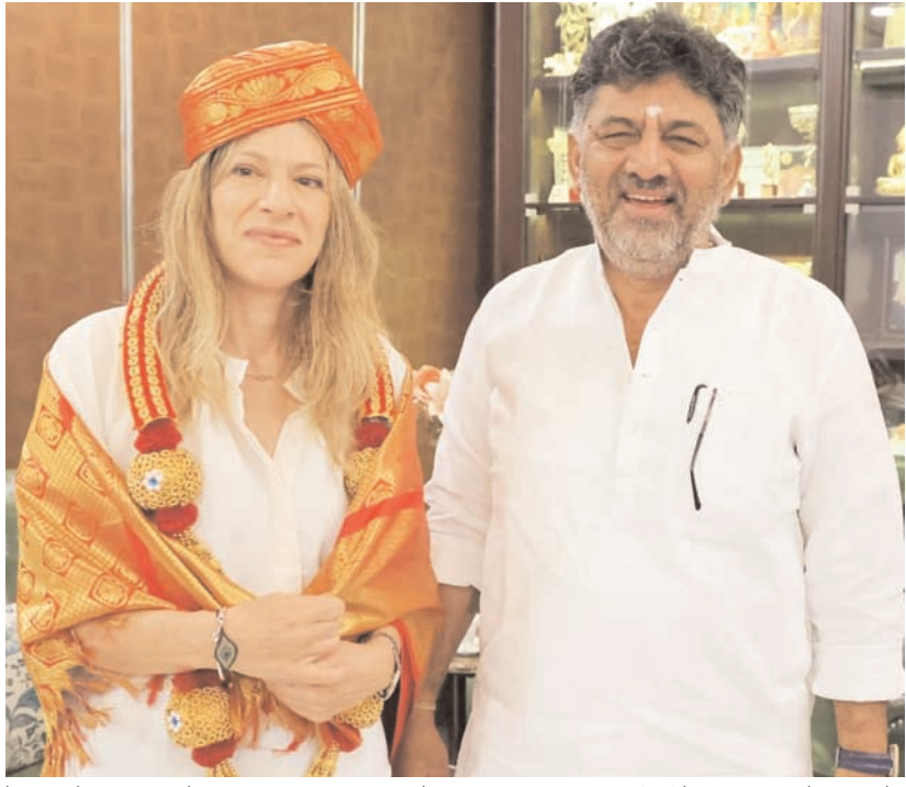
बेंगलूर में शनिवार को सदाशिवनगर स्थित अपने आवास पर उपमुख्यमंत्री डीके शिवकुमार ने भारत में इजरायल के राजदूत टॉमी बेन हेम मुलाकात की और बातचीत की।