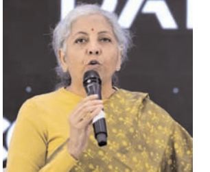
फोरम' की तरफ से आयोजित एक ऑनलाइन चर्चा में शामिल होते हुए कहा, निवेशकों को अग्रेज-मई 2024 में होने वाले आम चुनावों के नतीजों को लेकर थोड़ा भी घबराने की जरूरत नहीं है। उन्होंने कहा, निवेशकों का उम्मीद भरा इंतजार