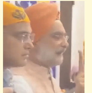
गुरुपर्व मनाने का सौभाग्य प्राप्त हुआ। इस दौरान कीर्तन सुना, गुरु नानक के एकजुटता, एकता और समानता के शाश्वत संदेश के बारे में चर्चा की, लंगर में शामिल हुआ और सभी के लिए आशीर्वाद मांगा।