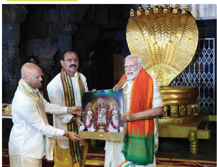
प्रधानमंत्री नरेंद्र मोदी ने सोमवार को आंध्र प्रदेश के तिरुमाला मंदिर में श्री वेंकटेश्वर स्वामी के दर्शन किये।