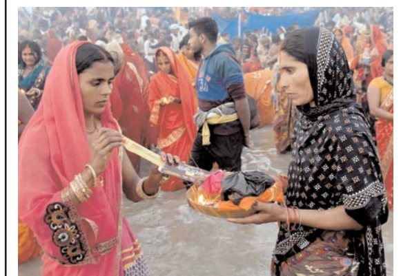
पटना में कार्तिक पूर्णिमा के अवसर पर सोमवार को पटना में श्रद्धालुओं ने गंगा नदी में पवित्र डुबकी लगाने के बाद पूजा-अर्चना की।

जिनके बारे में मैं बात नहीं कर सकता। एक बार आप फिल्म देखेंगे, तो आपको समझ आ जाएगा। मुझे लगता है कि संदीप रेड्डी वांगा ने इस फिल्म को एनिमल क्यों कहा, इसका कारण यह है कि जानवर अपनी प्रवृत्ति से बाहर व्यवहार करता है। वे सोच समझकर व्यवहार नहीं करते। तो यह किरदार जो मैं निभा रहा हूँ, वह अपने परिवार की रक्षा के लिए सहज व्यवहार करता है। वह यह नहीं सोच रहा है कि वह सहज भाव से व्यवहार कर रहा है, वह आवेगी है और मुझे लगता है कि यहीं पर एनिमल नाम आया। एक बार जब आप फिल्म देखेंगे तो आपको एहसास होगा कि यह फिल्म इस नाम पर फिट बैठती है।