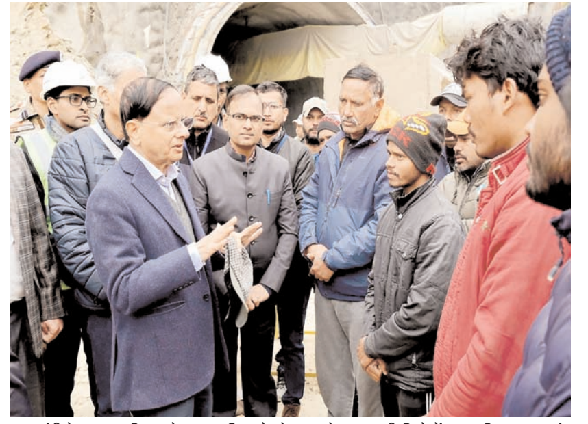
प्रधानमंत्री के प्रधान सचिव प्रमोद कुमार मिश्रा ने सोमवार को उत्तरकाशी जिले में ध्वस्त सिल्कयारा सुरंग में बचाव अधिकारियों से बात करते हुए।