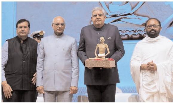
धनखड़ ने कहा, पिछली शताब्दी के महापुरुष महात्मा गांधी थे और इस शताब्दी के युग पुरुष नरेंद्र मोदी हैं, महात्मा गांधी ने सत्याग्रह एवं अहिंसा से हमें अंग्रेजों की गुलामी से छुटकारा दिलाया था तथा भारत के यशस्वी प्रधानमंत्री श्री नरेंद्र मोदी जी देश को उस रास्ते पर लाए हैं जिस रास्ते पर हम सदियों से देश को देखना चाहते थे। उन्होंने कहा कि इन दोनों महानुभावों में राष्ट्रपिता महात्मा गांधी और हमारे प्रधानमंत्री नरेंद्र मोदी में एक समानता है तथा वह समानता यह है कि ये दोनों ही लोग श्री राजचंद्र जी का हृदय से सम्मान करते हैं।

दक्षिण भारत राष्ट्रमत dakshinbharat.com नई दिल्ली/वार्ता। उपराष्ट्रपति जगदीप धनखड़ ने राष्ट्र सर्वोपरि की संस्कृति विकसित करने का आह्वान करते हुए कहा है कि महिला आरक्षण से समाज में सकारात्मक परिवर्तन आएगा। धनखड़ ने सोमवार को श्रीमद राजचंद्र जयंती-‘आत्मकल्याण दिवस’ पर आयोजित समारोह को संबोधित करते हुए कहा कि देश में ऐसा वातावरण और ऐसी संस्कृति विकसित करने की आवश्यकता है जिसमें सभी लोग राष्ट्र को सर्वोपरि रखें। उन्होंने कहा, हमें भारतीयता में विश्वास करना चाहिए और भारतीय होने पर गर्व करना चाहिए। हमें हमारी ऐतिहासिक उपलब्धियां पर गर्व करना चाहिए। हमने जिस चीज का सपना नहीं देखा था, कभी कल्पना नहीं की थी आज वह सब जमीनी हकीकत है। इस अवसर पर उपराष्ट्रपति ने श्रीमद राजचंद्र जी की प्रतिमा का अनावरण भी किया। राजचंद्र जी जितना महत्वपूर्ण व्यक्ति इतिहास में मिलना मुश्किल है। उन्होंने कहा कि भारत सदियों से महापुरुषों की जन्मी रहा है। भारत विश्व संस्कृति का केंद्र है। भारत की सभ्यता 5000 वर्षों से भी प्राचीन है। दुनिया में ऐसा कोई देश नहीं है। उन्होंने कहा कि हमारी ताकत हमारा आध्यात्मिक ज्ञान और संस्कृतिक है। दुनिया के महान देशों के लोग शांति की खोज में हमारे देश में आते हैं। भारत सदियों से संस्कृति और सभ्यतागत लोकाचार का केंद्रबिंदु रहा है। उन्होंने कहा पृथ्वी सिर्फ मनुष्य मात्र के लिए नहीं है। यह धरा सभी प्राणियों के लिए है।