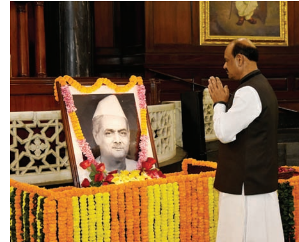
लोकसभा अध्यक्ष ओम बिरला ने सोमवार को नई दिल्ली में सेंट्रल हॉल (संविधान सदन) में पूर्व लोकसभा अध्यक्ष गणेश वासुदेव मावलकर को उनकी जयंती के अवसर पर श्रद्धांजलि अर्पित की।