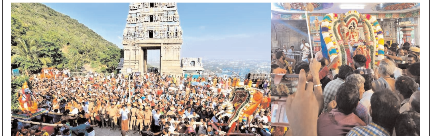
कोयम्बटूर के पास स्थित मारुतुमलाई स्थित कार्तिकेय मंदिर में शनिवार को सुरसमाहारम् का आयोजन किया गया। जिसमें बड़ी संख्या में श्रद्धालुओं ने भाग लिया। इस उत्सव में भगवान मुल्गान द्वारा राक्षस का वध किया जाता है उसके उपरंत सुरसमाहारम् होता है। तिरुचेन्दुर के प्रसिद्ध मंदिर के बाद लोकप्रिय इस मंदिर में आयोजित समाारोह में भगवान की शोभायात्रा निकाली गई और लोगों ने दर्शन किए।