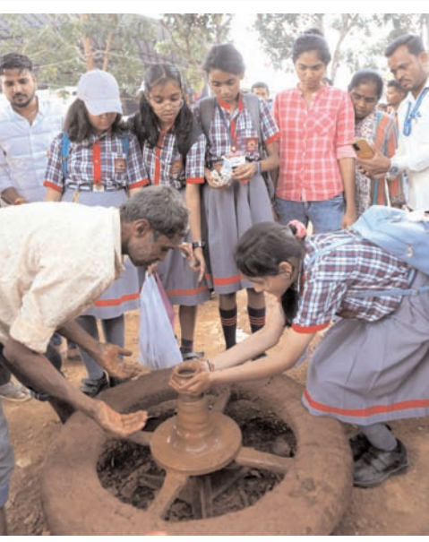
बेंगलूर में शनिवार को कृषि मेला 2023 प्रदर्शनी के बारे में जानकारी लेती स्कूली छात्रा।

जिले के मंगलूर की वकील नेत्रावती को मुख्य परीक्षा के लिए चुना गया था। उन्होंने उच्च न्यायालय में एक अनुरोध प्रस्तुत किया कि उन्हें जिले में ही परीक्षा देने की अनुमति दी जाए क्योंकि वह गर्भवती होने के कारण स्वास्थ्य स्थितियों की वजह से बेंगलूर की यात्रा करने में असमर्थ हैं।