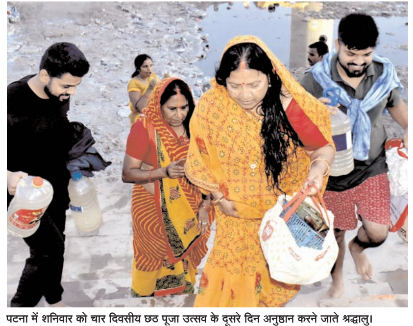
पटना में शनिवार को चार दिवसीय छठ पूजा उत्सव के दूसरे दिन अनुष्ठान करने जाते श्रद्धालु।