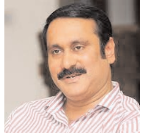
दक्षिण भारत राष्ट्रमत dakshinbharat.com

चेन्नई। पीएमके नेता अंबुमणि रामदास ने डीएमके के नेतृत्व वाली तमिलनाडु सरकार से जाति जनगणना कराने को कहा। उन्होंने पूछा, "सामाजिक न्याय की बात करने वाली द्रमुक सरकार को जाति जनगणना कराने से कौन रोक रहा है?" उन्होंने कहा कि सभी 540 जातियों की वर्तमान स्थिति को समझकर उसके अनुसार योजनाएं लानी चाहिए। तमिलनाडु सरकार और तमिलनाडु के राज्यपाल के बीच चल रही खींचतान पर टिप्पणी करते हुए उन्होंने कहा कि