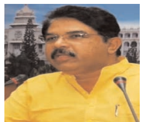
दक्षिण भारत राष्ट्रमत dakshinbharat.com

बेंगलूर। कर्नाटक में विपक्ष के नेता (एलओपी) आर. अशोक ने वीर सावरकर की तस्वीर हटाने के खिलाफ कांग्रेस सरकार को चेतावनी दी है। अशोक ने पत्रकारों से कहा कि कांग्रेस सरकार वीर सावरकर की तस्वीर हटाकर पूर्व प्रधानमंत्री जवाहरलाल नेहरू की तस्वीर लगाने की योजना बना रही है। अशोक ने कहा, "वीर सावरकर एक देशभक्त हैं, जो स्वतंत्रता आंदोलन के दौरान जेल में बंद थे।" उन्होंने कहा कि बीजेपी सरकार ने विधानसभा में सावरकर की तस्वीर लगाई थी और अब कांग्रेस उसे हटाने की योजना बना रही है। अशोक ने कहा, उनका (सरकार) तर्क है कि सावरकर की तस्वीर के बजाय दिवंगत पूर्व प्रधान मंत्री जवाहरलाल नेहरू की तस्वीर लगाई जानी चाहिए। उन्होंने कहा कि नेहरू की तस्वीर लगाना वंशानुगत राजनीति का महिमांडन है। उन्होंने कहा, कांग्रेस सरकार कर्नाटक में केवल दादा, मां, बेटे और पोते की तस्वीरें चाहती है। विपक्ष के रूप में, हम सत्तारूढ़ सरकार को चुनौती देंगे और विरोध प्रदर्शन करेंगे। उन्होंने कहा कि कांग्रेस सरकार द्वारा उठाए गए सांप्रदायिक कदमों और टीपू