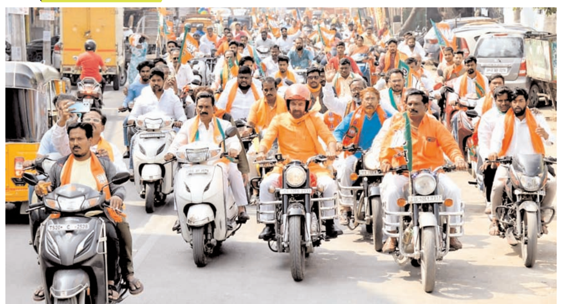
हैदराबाद में केंद्रीय पर्यटन और संस्कृति मंत्री और तेलंगाना भाजपा अध्यक्ष जी किशन रेड्डी ने गुल्वार को आगामी तेलंगाना विधान सभा चुनाव 2023 के लिए सिकंदराबाद निर्वाचन क्षेत्र में एक बाइक रैली में भाग लिया।