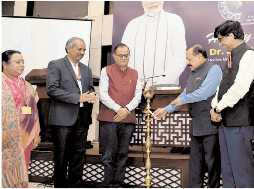
नई दिल्ली में विज्ञान और प्रौद्योगिकी, प्रधान मंत्री कार्यालय और अंतरिक्ष राज्य मंत्री जितेंद्र सिंह न्यू में कर्टन रेजर कार्यक्रम में दीप प्रज्वलित करते हुए।