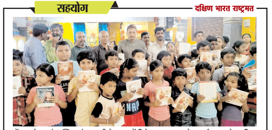
दक्षिण भारत राष्ट्रमत dakshinbharat.com