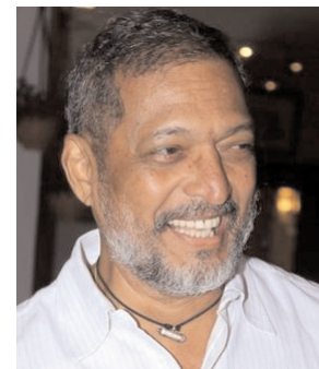
है।" एक अन्य उपयोगकर्ता ने लिखा, "नाना पाटेकर ने एक फैन को थप्पड़ मार दिया, जो उनके

प्रशंसक उनके पास आता है और साथ में सेल्फी खींचने की कोशिश करता है। वीडियो में प्रशंसक की इस हरकत से गुस्साए पाटेकर उसके सिर के पीछे थप्पड़ मारते नजर आ रहे हैं। इसके बाद पाटेकर के पास खड़ा एक सुरक्षाकर्मी उस युवक की गर्दन पकड़कर उसे दूर ले जाता दिखाई दे रहा है। प्रशंसक को थप्पड़ मारने के लिए पाटेकर की सोशल मीडिया पर खूब आलोचना हो रही है। एक उपयोगकर्ता ने सोशल मीडिया मंच 'एक्स' पर लिखा, "नाना के साथ सेल्फी लेना सेहत के लिए हानिकारक हो सकता