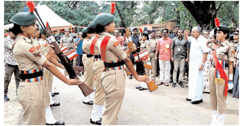
केरल के मुख्यमंत्री पिनाराई विजयन बुधवार को तिरुवनंतपुरम में सरकारी महिला कॉलेज की 125वीं वर्षगांठ समारोह के अवसर पर एनसीसी कैडेटों से गार्ड ऑफ ऑनर प्राप्त करते हुए।