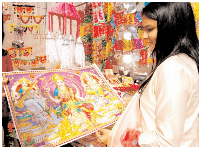
हरिद्वार में शनिवार को दिवाली पर लक्ष्मी पूजा के लिए एक दुकान से भगवान की फोटो खरीदती एक महिला।