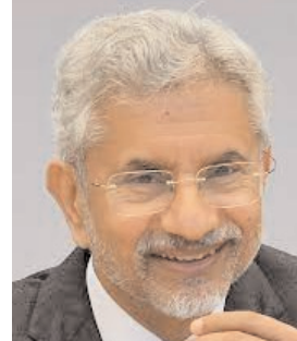
विदेश मंत्रालय ने दोनों देशों के रिश्तों को मधुर और प्रगतिशील बताया। भारत-ब्रिटेन

अगले कुछ महीनों में होने वाली संभावित भारत यात्रा के संबंध में तैयारियों पर चर्चा की जाएगी। विदेश मंत्रालय ने बताया, विदेश मंत्री एस.जयशंकर 11 से 15 नवंबर तक ब्रिटेन की आधिकारिक यात्रा पर होंगे। मंत्रालय द्वारा जारी बयान में कहा गया, भारत और ब्रिटेन के द्विपक्षीय संबंध बढ़ रहे हैं। इस यात्रा के दौरान विदेश मंत्री अपने ब्रिटिश समकक्ष सर जेम्स क्लेवेली और अन्य गणमान्य लोगों के साथ मुलाकात करेंगे।