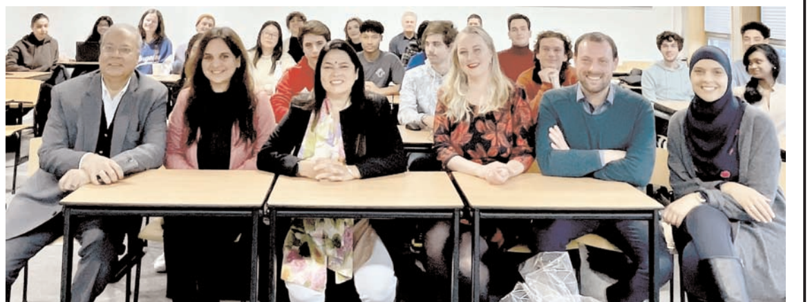
केंद्रीय विदेश राज्य मंत्री मीनाक्षी लेखी शनिवार को नीदरलैंड की अपनी यात्रा के दौरान हेग यूनिवर्सिटी ऑफ एनलाइड साइंसेज के छात्रों और संकाय के साथ एक इंटरैक्टिव सत्र के दौरान।