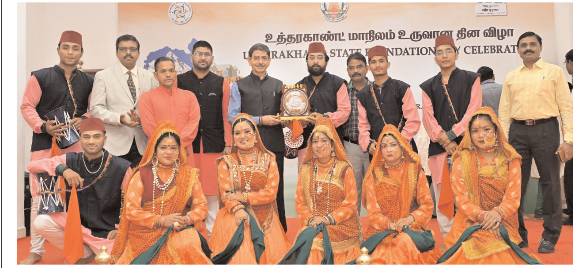
गुरुवार को चेन्नई राजभवन में उत्तराखंड राज्य स्थापना दिवस का आयोजन किया गया। राज्यपाल आर.एन रवि ने सभी उत्तराखंडियों को स्थापना दिवस की शुभकामनाएं दीं। इस मौके पर सांस्कृतिक कार्यक्रम हुए।