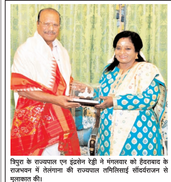
त्रिपुरा के राज्यपाल एन इंद्रसेन रेड्डी ने मंगलवार को हैदराबाद के राजभवन में तेलंगाना की राज्यपाल तमिलिसाई सोंदरराजन से मुलाकात की।