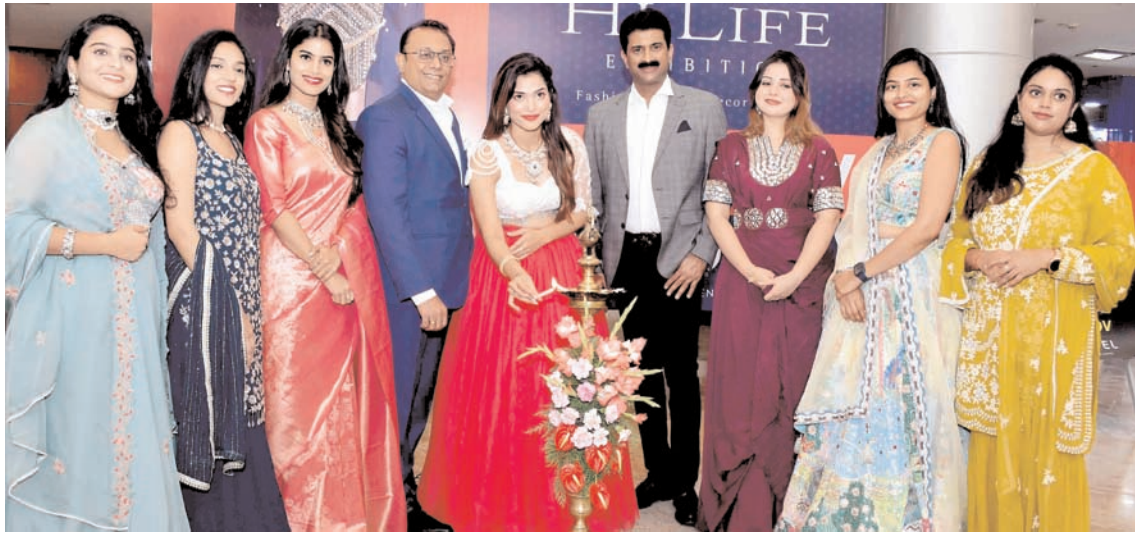
हैदराबाद में मंगलवार को हाईलाइट प्रदर्शनी के शुभारंभ के दौरान मॉडल और फैशन प्रेमी।