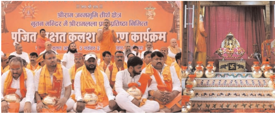
श्रीरामलला प्राण प्रतिष्ठा बाइस जनवरी को आयोजित कार्यक्रम को दिव्य स्वरूप प्रदान करने के लिये देश के पंचतलिस प्रांतों से कार्यकर्ताओं को अवध धाम में आमंत्रित किया गया है। यह कर सम्पूर्ण राष्ट्र राममय होगा और पूजित अक्षत को लेकर जायेंगे।

इस अक्षत कलश की पूजा श्रीरामजन्मभूमि पर विराजमान रामलला के अस्थायी मंदिर में आज सम्पन्न हुआ। उन्होंने बताया कि