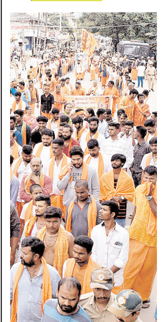
रविवार को चिक्कमलूरु में दत्तमाला अभियान के तहत श्रीरामसेना के कार्यकर्ताओं ने शोभायात्रा निकाली।