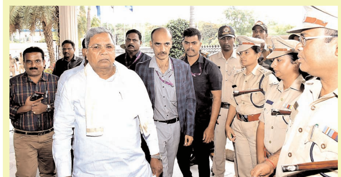
रविवार को मैसूर में एक बैठक के दौरान दशहरा को सफल बनाने के लिए जिला स्तरीय अधिकारियों को बधाई देते हुए मुख्यमंत्री सिद्धरामैया।

की शराब, 28.6 करोड़ रुपये का गांजा और वितरित करने के लिए 52.5 करोड़ रुपये की कीमत की अन्य चीजें जब्त की गई हैं।