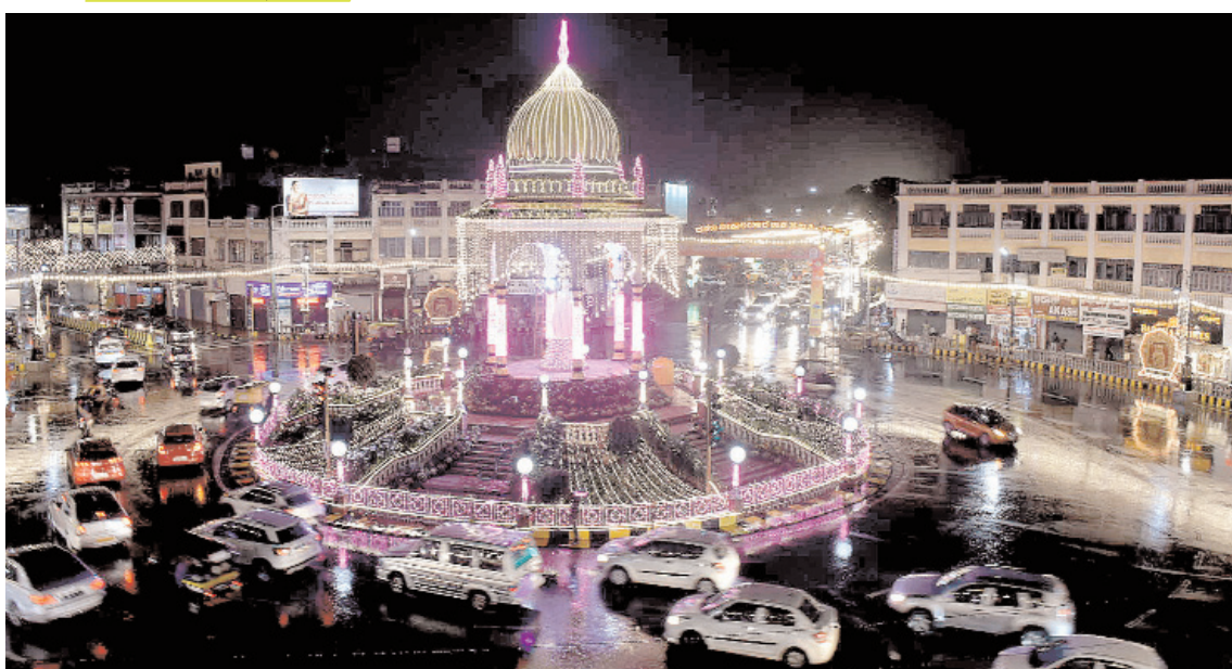
मैसूर में रविवार को दशहरा लाइटिंग के आखिरी दिन लोगों का आकर्षण रहा। दशहरा के मूड को देखने के लिए आई बारिश का भी लोगों ने खूब आनंद उठाया।