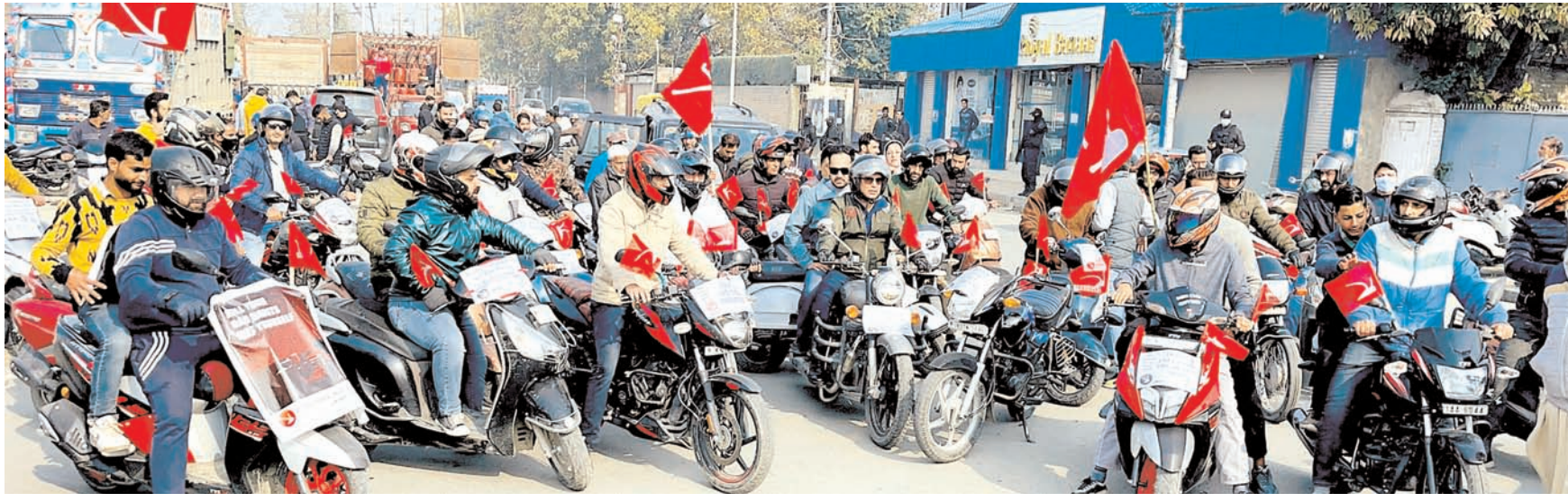
जम्मू-कश्मीर नेशनल कॉन्फ्रेंस ने रविवार को श्रीनगर में समाज में नशीली दवाओं के खतरों के प्रतिकूल प्रभावों के बारे में लोगों को शिक्षित करने के लिए एक मोटरसाइकिल रैली का आयोजन किया।