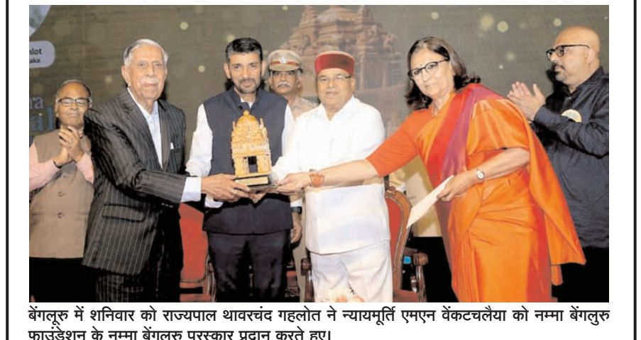
बेंगलूरु में शनिवार को राज्यपाल थावरचंद गहलोत ने न्यायमूर्ति एमएन वेंकटचलैया को नम्मा बेंगलूरु फाउंडेशन के नम्मा बेंगलूरु पुरस्कार प्रदान करते हुए।