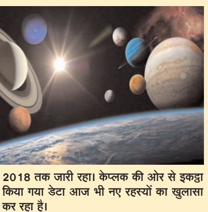
2018 तक जारी रहा। केपलर की ओर से इकट्ठा किया गया डेटा आज भी नए रहस्यों का खुलासा कर रहा है।

थोड़े बड़े और संभवतः चट्टानी हैं। इनका एक पतला वातावरण हो सकता है। अन्य पांच ग्रह काफी बड़े हैं। प्रत्येक की त्रिज्या पृथ्वी के आकार से लगभग दोगुनी है और उनके घने वायुमंडल में ढके होने की उम्मीद है। केपलर-385 प्रणाली का इतने विस्तार से वर्णन करने की क्षमता लेट्टेस्ट कैटलॉग की क्रांति दीखाता है। पिछले कैटलॉग का उद्देश्य अन्य सितारों के आसपास ग्रहों की व्यापकता का आकलन करना था। वहीं नए कैटलॉग का उद्देश्य प्रत्येक प्रणाली के बारे में सटीक डेटा प्रदान करना है। केपलर का प्राथमिक अवलोकन 2013 में पूरा हुआ था। उसके बाद इसके मिशन को विस्तार दिया गया, जिसे घ 2 के नाम से जाना जाता है, जो