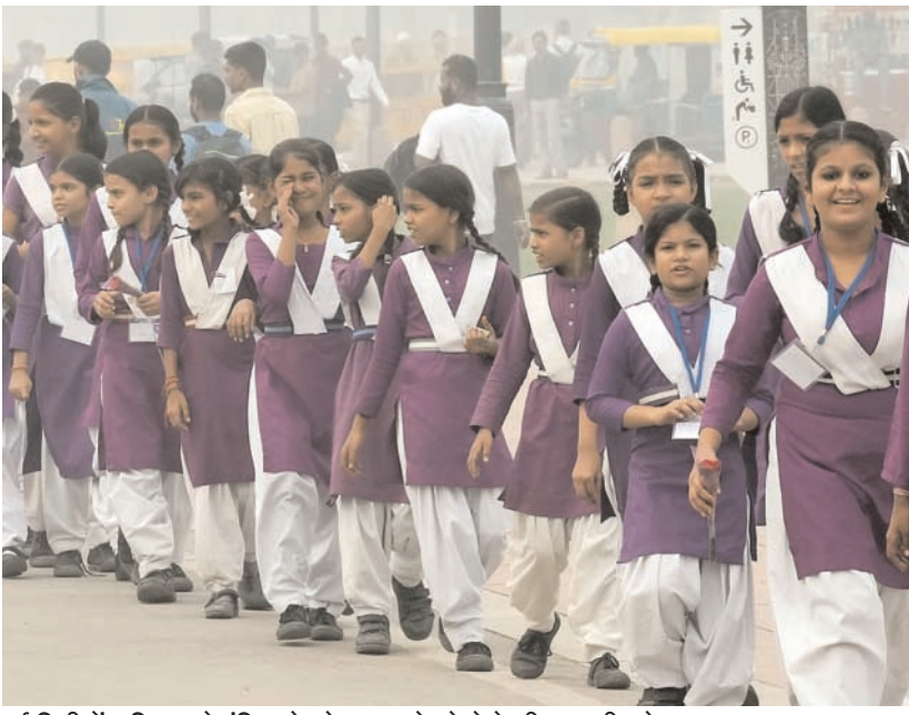
नई दिल्ली में शनिवार को इंडिया गेट के पास घने कोहरे के बीच स्कूली बच्चे।