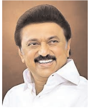
द्रविड़ मुनेत्र कश्गम सरकार द्वारा उठाए गए कदमों के कारण मानसून

स्टालिन ने सोशल मीडिया मंच 'एक्स' पर एक पोस्ट में कहा,