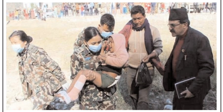
नेपाल सेना के सदस्यों ने पश्चिमी नेपाल के जाजरकोट जिले में बचाव अभियान के दौरान घायलों को सुरक्षित स्थान पर ले जाते हुए।

समुदाय) को चोर क्यों कहते हैं। गांधी ने सभा को संबोधित करते हुए कहा कि भाजपा के नेता आदिवासियों को वनवासी कहते हैं। उन्होंने कहा, 'नरेंद्र मोदी जी ने, आरएसएस (राष्ट्रीय स्वयं सेवक संघ) के लोगों ने और भाजपा नेताओं ने आदिवासियों के लिए नया शब्द निकला है, वनवासी। आदिवासी और वनवासी शब्द में बहुत बड़ा फर्क है... आदिवासी का मतलब है कि जो इस देश के पहले असली मालिक हैं। आदिवासी का मतलब होता है देश का जल, जंगल और जमीन एक दिन आपका हुआ करता था... भाजपा इस शब्द का प्रयोग नहीं करना चाहती है क्योंकि यदि भाजपा इस शब्द का प्रयोग करेगी तो उसे आपके जल जंगल जमीन आपको वापस देनी होगी।'