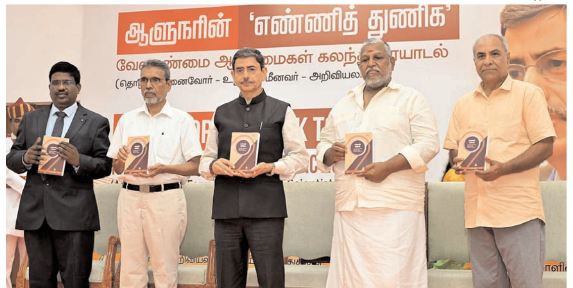
तमिलनाडु के राज्यपाल आरएन रवि शनिवार को चेन्नई में फार्म पर्सनेलिटीज के साथ 'थिंक टू डेयर' श्रृंखला की 12वीं बातचीत के दौरान राज्य में सब्जी की खेती पर 200वीं पुस्तक का विमोचन करते हुए।