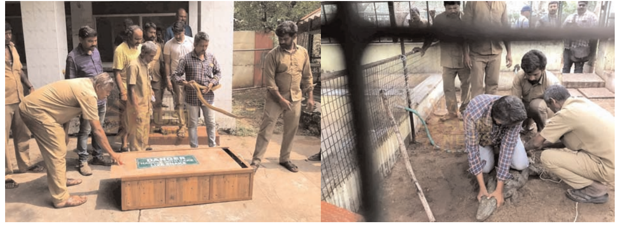
सरीसृपों को राज्य के अन्य चिड़ियाघरों में भेजने का काम शुरू कर दिया गया। शहर के एक मात्र चिड़ियाघर के बंद होने से स्थानीय लोग नाशुश हैं।

कोयम्बटूर। कोयम्बटूर के वीओसी पार्क के निकट बने 50 साल पुराने शहर के एक मात्र जू को आज लोगों के लिए बंद करना पड़ा। यह बहुत से जानवर और पशुओं का घर है। पिछले दो साल से इसकी देखरेख सही तरीके से नहीं हो पा रही है। जिसके चलते केन्द्रीय प्रशासन से इस ओर ध्यान देने की बात प्रदेश सरकार को दी थी। लेकिन कोई कदम नहीं उठाए जाने के बाद भी बवतार हालात में होने के कारण इसको बंद करना पड़ा। इसमें रह रहे जानवर, पक्षी, और