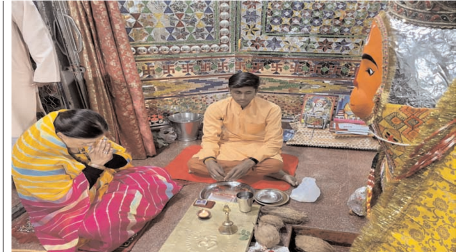
झालावाड़ में शनिवार को वोट डालने से पहले झालावाड़ स्थित राडी के बालाजी मंदिर में पूजा अर्चना करती पूर्व मुख्यमंत्री वसुंधरा राजे।

महंत बालक नाथ ने इस दौरान पत्रकारों को संबोधित करते हुए कहा कि तिजारा में भारी संख्या में फर्जी मतदान होने की आशंका बनी हुई है। क्योंकि यहां के काफी लोग जमात में गए हुए हैं। कुछ लोग बाहर कमाने हुए हैं। उनके भी वोट डाले जाएंगे। इसके मतलब यहां फर्जी पोलिंग होगी। इसके लिए बूथ बार जिला प्रशासन को लिखित में दे दिया गया है। उन्होंने बताया कि कोई भी व्यक्ति फर्जी मतदान ना करें वरना इसका उसे बड़ा खामियाजा भुगतना पड़ेगा। महंत बालक नाथ ने बताया कि भारत के लोग भाग्य विधाता हैं, प्रदेश की जनता अंतराला से सुशासन विकास एवं बेहतर कानून व्यवस्था को लेकर भारतीय जनता पार्टी को वोट करेगी। पिछले 5 साल से राजस्थान की जनता कांग्रेस को सत्ता से बाहर करने का सपना संजोए हुए है।