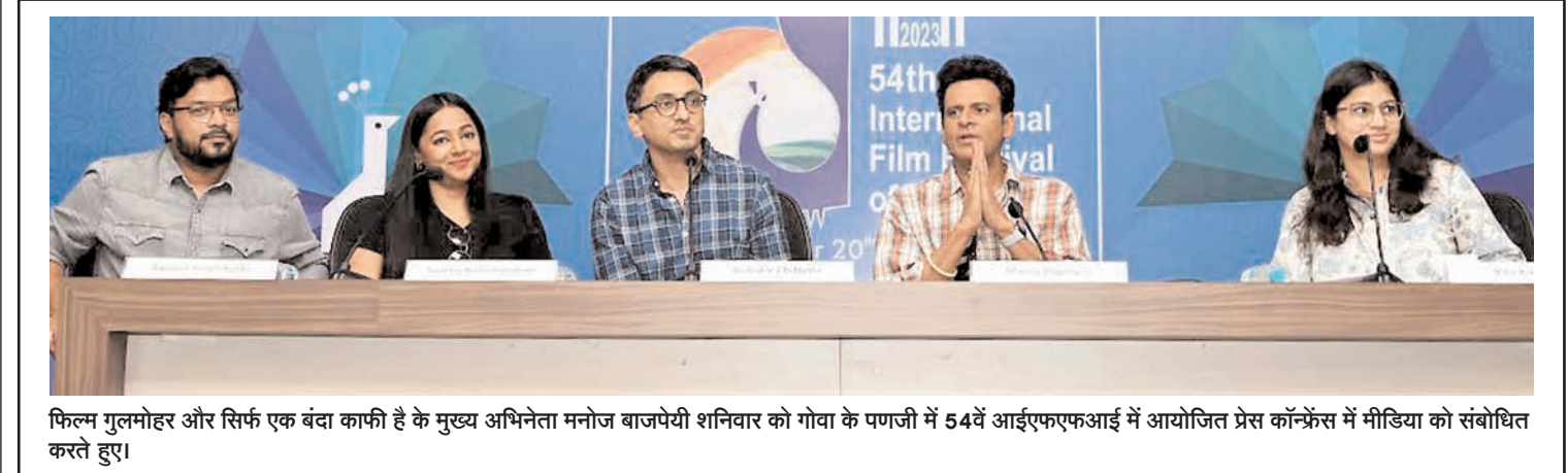
फिल्म गुलमोहर और सिर्फ एक बंदा काफी है के मुख्य अभिनेता मनोज बाजपेयी शनिवार को गोवा के पणजी में 54वें आईएफएफआई में आयोजित प्रेस कॉन्फ्रेंस में मीडिया को संबोधित करते हुए।