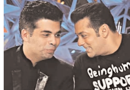
जौहर की वर्ष 1998 में प्रदर्शित फिल्म 'कुछ कुछ होता है' में काम किया था। इस फिल्म में सलमान खान ने कैमियो रोल किया था।

सलमान खान और करण जोहर 25 साल बाद एक बार फिर साथ में आ रहे हैं। सलमान खान ने करण