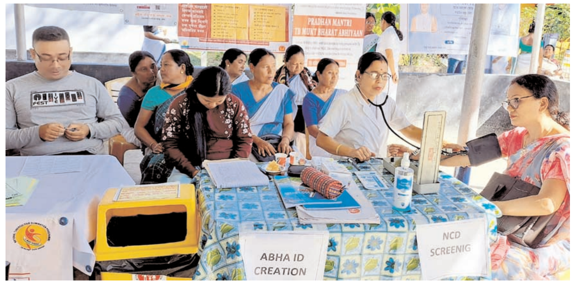
डिब्रूगढ़ में शनिवार को बारबुरा ब्लॉक के अंतर्गत बोपाथर जीपी कार्यालय परिसर में आयोजित विकसित भारत संकल्प यात्रा के दौरान आयोजित स्वास्थ्य शिविर की झलकियां।