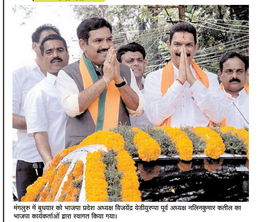
मंगलूरु में बुधवार को भाजपा प्रदेश अध्यक्ष विजयेंद्र येडीयुरप्पा पूर्व अध्यक्ष नलिनकुमार कतील का भाजपा कार्यकर्ताओं द्वारा स्वागत किया गया।

दक्षिण भारत राष्ट्रमत dakshinbharat.com बेंगलूरु/हैदराबाद/दक्षिण भारत। भारतीय जनता पार्टी (भाजपा) के वरिष्ठ नेता बी एस येडीयुरप्पा ने बुधवार को कांग्रेस पर कर्नाटक में सत्ता में आने के बाद चुनाव पूर्व किए अपने पांच वादों को पूरा नहीं कर राज्य के लोगों को धोखा देने का आरोप लगाया। कर्नाटक के पूर्व मुख्यमंत्री ने तेलंगाना के लोगों से कांग्रेस पार्टी के 'झूठ और खोखले वादों' के बहकावे में नहीं आने की अपील की। चुनाव प्रचार के लिए तेलंगाना पहुंचे येडीयुरप्पा ने यहां पत्रकारों को संबोधित करते हुए कहा कि कर्नाटक मॉडल' अन्य राज्यों में कांग्रेस का चुनावी मॉडल है। कांग्रेस ने इस साल मई में कर्नाटक विधानसभा चुनाव में मतदाताओं से पांच गारंटी का वादा किया था। येडीयुरप्पा ने आरोप लगाया कि कर्नाटक में चुनाव जीतने के बाद अब कांग्रेस तेलंगाना और अन्य चुनावी राज्यों में 'कर्नाटक मॉडल' बेच रही है। उन्होंने कहा, पार्टी ने चुनाव जीतने के बाद वास्तव में कर्नाटक के लोगों को धोख दिया है क्योंकि उसकी सरकार गारंटी योजनाओं को लागू करने में नाकाम रही है। उन्होंने कहा, कांग्रेस के घोषणापत्र में छह गारंटी योजनाएं हैं जो सिर्फ राज्य के मतदाताओं को धोखा देने के लिए हैं। मैं तेलंगाना के लोगों से अपील और अनुरोध करता हूं कि वे कांग्रेस पार्टी के झूठ और खोखले वादों के झंसे में नहीं आएं।