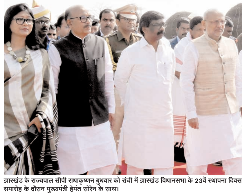
झारखंड के राज्यपाल सीपी राधाकृष्णन बुधवार को रांची में झारखंड विधानसभा के 23वें स्थापना दिवस समारोह के दौरान मुख्यमंत्री हेमंत सोरेन के साथ।