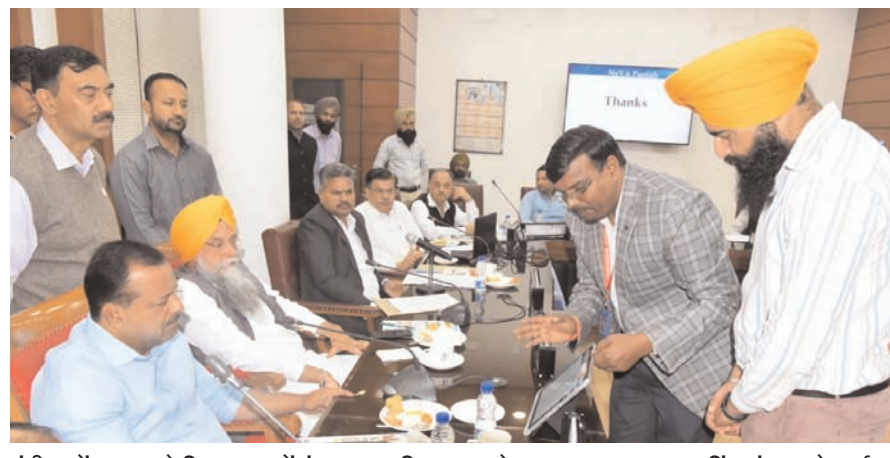
चंडीगढ़ में बुधवार को विधान सभा में पंजाब राज्य विधान सभा के अध्यक्ष सरदार कुलतार सिंह संदवान से कर्नाटक के विधानसभा अध्यक्ष यूटी खादर ने मुलाकात की और आवश्यक जानकारी प्राप्त की।