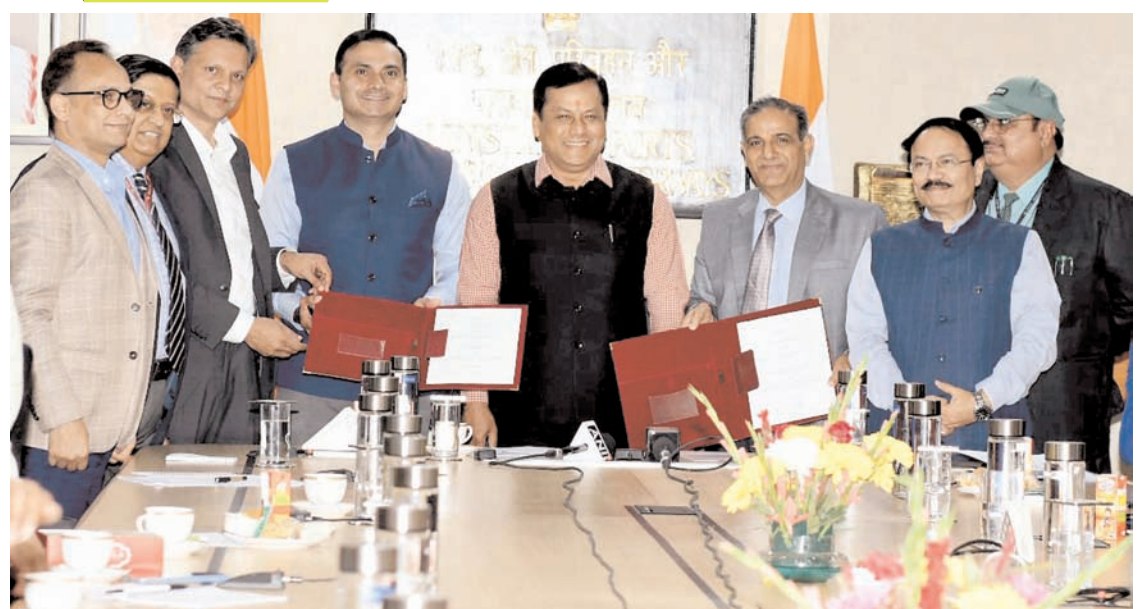
नई दिल्ली में केंद्रीय बंदरगाह, जहाजरानी, जलमार्ग और आयुष मंत्री सर्वानंद सोनोवाल नई दिल्ली में भारतीय अंतर्देशीय जलमार्ग प्राधिकरण (आईडब्ल्यूआई) और अमेजॉन सेलर सर्विसेज प्राइवेट लिमिटेड (अमेजॉन) के बीच समझौता ज्ञापन पर हस्ताक्षर के गवाह बने।