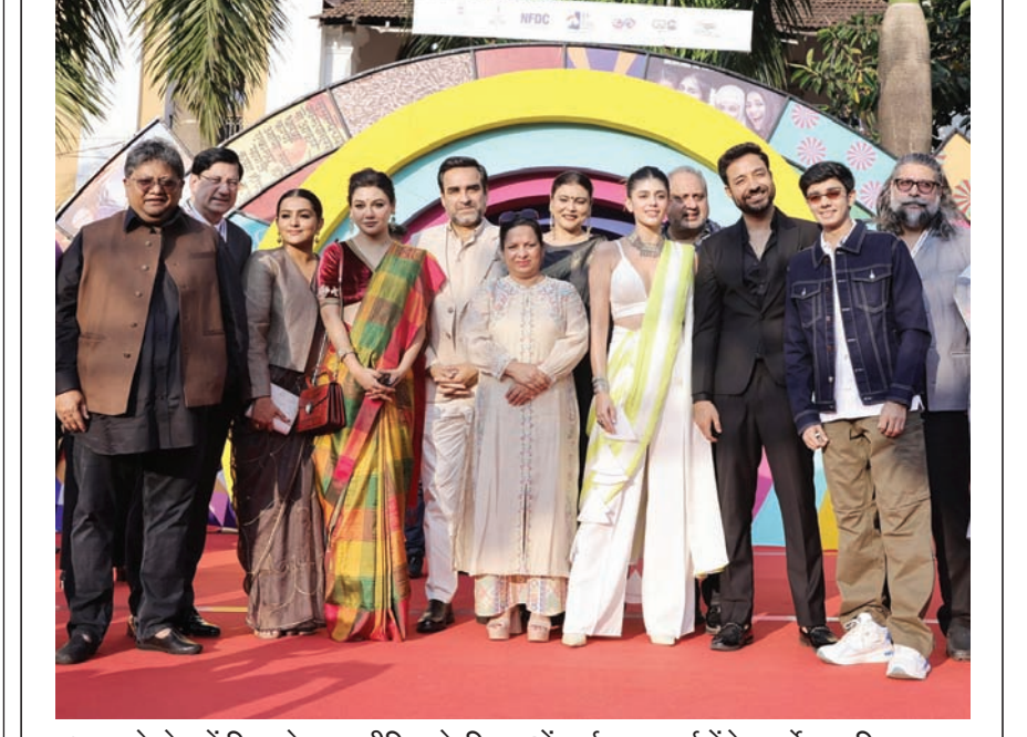
बुधवार को गोवा में फिल्म के गाला प्रीमियर के लिए 54वें आईएफएफआई में रेड कार्पेट पर फिल्म कडक सिंह की कार्ट और झू।