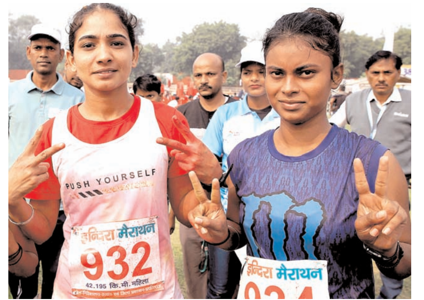
प्रयागराज में पूर्व प्रधानमंत्री इंदिरा गांधी की जयंती पर रविवार को प्रयागराज में आयोजित इंदिरा मेराथन में भाग लेते लोग।