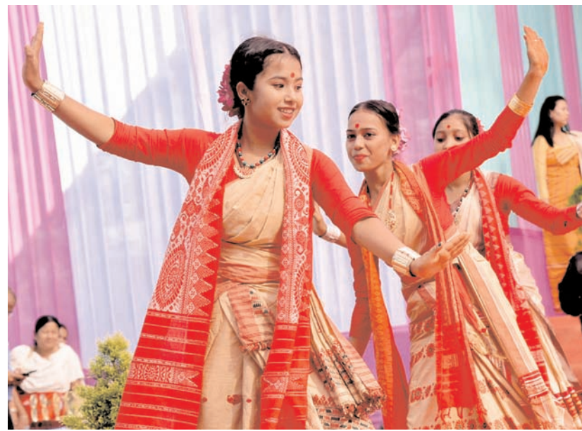
असम के बक्साम में रविवार को विकसित भारत संकल्प यात्रा पर एक कार्यक्रम में पारंपरिक नृत्य करते बच्चे।