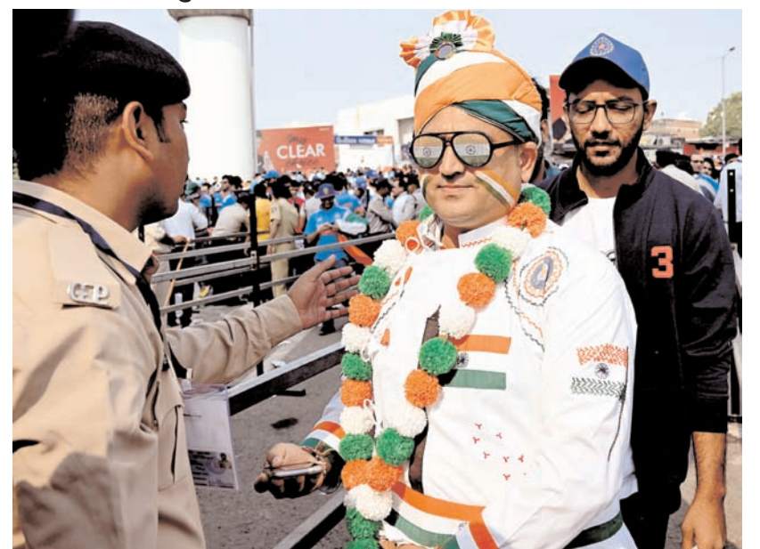
अहमदाबाद के नरेंद्र मोदी स्टेडियम में भारत और ऑस्ट्रेलिया के बीच आईसीसी विश्व कप 2023 के फाइनल मैच से पहले क्रिकेट प्रशंसक खुशी मनाते हुए।