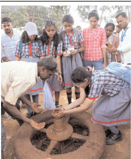
बंगलूरु में शनिवार को कृषि मेला 2023 प्रदर्शनी के बारे में जानकारी लेती स्कूली छात्रा।

दक्षिण भारत राष्ट्रमत dakshinbharat.com बंगलूरु। कर्नाटक उच्च न्यायालय ने दीवानी न्यायाधीश परीक्षा देने की इच्छुक परीक्षार्थी को अपने गृह नगर मंगलूरु में परीक्षा देने की अनुमति दे दी है जो करीब आठ महीने की गर्भवती हैं और बंगलूरु की यात्रा करने में असमर्थ हैं। उच्च न्यायालय ने 57 न्यायाधीशों की भर्ती के लिए इस साल मार्च में परीक्षा आयोजित करने की अधिसूचना जारी की थी। प्रारंभिक परीक्षा 23 जुलाई, 2023 को आयोजित की गई थी, जिसमें 6,000 से अधिक परीक्षार्थियों में से 1,022 को बंगलूरु में शनिवार और रविवार को होने वाली मुख्य परीक्षा के लिए चुना गया। दक्षिण कन्नड़ जिले के मंगलूरु की वकील नेत्रावती को मुख्य परीक्षा के लिए चुना था। उन्होंने उच्च न्यायालय में एक अनुरोध प्रस्तुत किया कि उन्हें जिले में ही परीक्षा देने की अनुमति दी जाए क्योंकि वह गर्भवती होने के कारण स्वास्थ्य स्थितियों की वजह से बंगलूरु की यात्रा करने में असमर्थ हैं। दीवानी न्यायाधीशों की सीधी भर्ती के लिए गठित उच्च न्यायालय की समिति में न्यायमूर्ति पीएस विनेश कुमार, न्यायमूर्ति के सोमशेखर, न्यायमूर्ति एस. सुनील दत्त यादव, न्यायमूर्ति अशोक एस. किनागी और न्यायमूर्ति एम. नागप्रसन्ना शामिल हैं, जिन्होंने नेत्रावती के आवेदन पर विचार करने के बाद उन्हें दक्षिण कन्नड़ जिले में ही परीक्षा देने की अनुमति दी। मुख्य न्यायाधीश प्रसन्ना बी. वराले ने समिति के फैसले को मंजूरी दे दी है। समिति और मुख्य न्यायाधीश के निर्देश के बाद, उच्च न्यायालय के रजिस्ट्रार ने मंगलूरु में जिला न्यायालय में अकेली परीक्षार्थी के लिए परीक्षा आयोजित करने के सिलसिले में एक महिला न्यायिक अधिकारी की तैनाती की है।