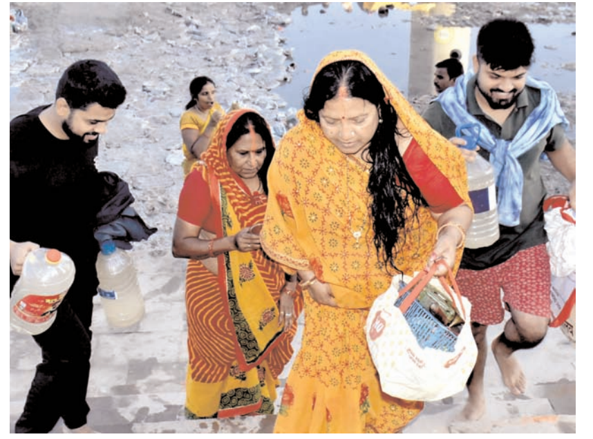
पटना में शनिवार को चार दिवसीय छठ पूजा उत्सव के दूसरे दिन अनुष्ठान करने जाते श्रद्धालु।