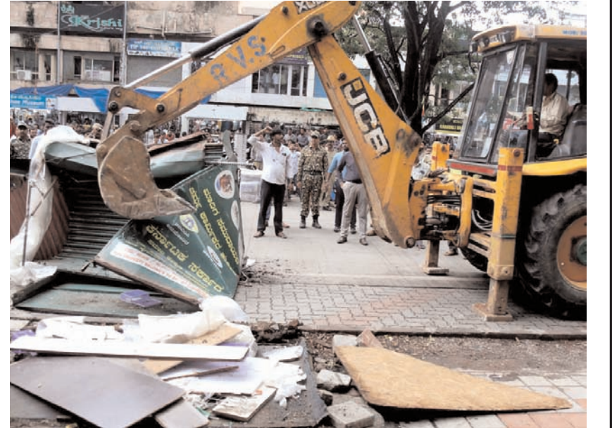
बेंगलूर में मंगलवार को बीबीएमपी विध्वंस दस्ते ने जायनगर चौथे ब्लॉक शॉपिंग कॉम्प्लेक्स में फुटपाथ सफाई अभियान चलाते हुए।