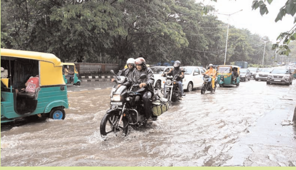
सोमवार रात को भारी बारिश के कारण मंगलवार को बेंगलूर की सड़कों पर पानी भर गया।