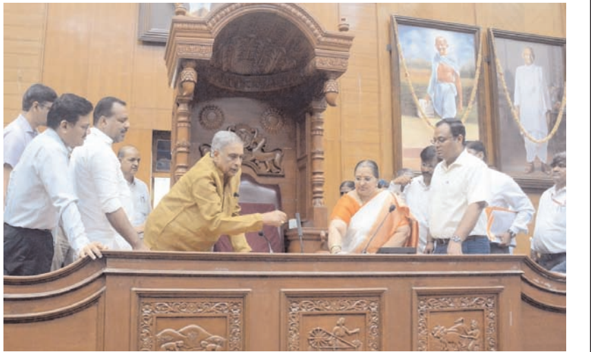
मंगलवार को बेलगावी में सुवर्ण विधान सौधा (एसवीएस) का निरीक्षण करते हुए कर्नाटक विधानसभा अध्यक्ष यू टी खावर और विधान परिषद के अध्यक्ष बसवराज होराड़ी।