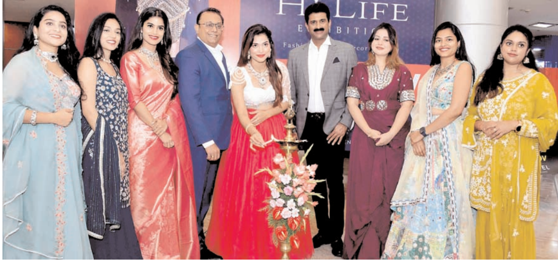
हैदराबाद में मंगलवार को हाईलाइट प्रदर्शनी के शुभारंभ के दौरान मॉडल और फैशन प्रेमी।