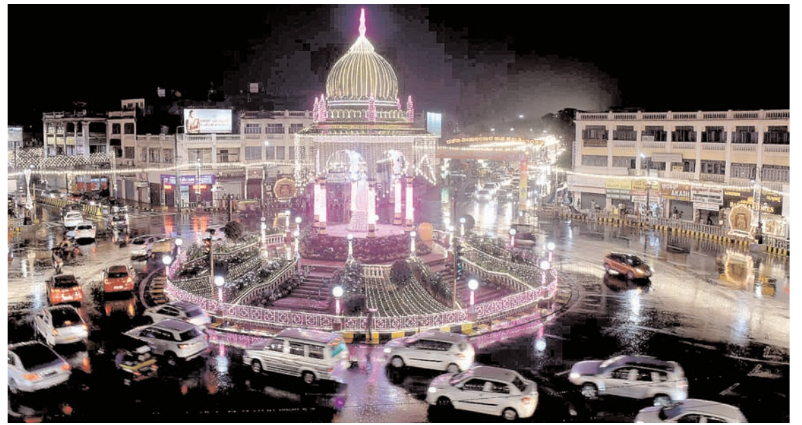
मैसूरु में रविवार को दशहरा लाइटिंग के आखिरी दिन लोगों का आकर्षण रहा। दशहरा के मूड को देखने के लिए आई बारिश का भी लोगों ने खूब आनन्द उठाया।