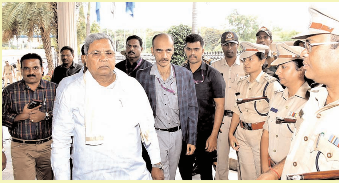
रविवार को मैसूरु में एक बैठक के दौरान दशहरा को सफल बनाने के लिए जिला स्तरीय अधिकारियों को बधाई देते हुए मुख्यमंत्री सिद्धरामैया।