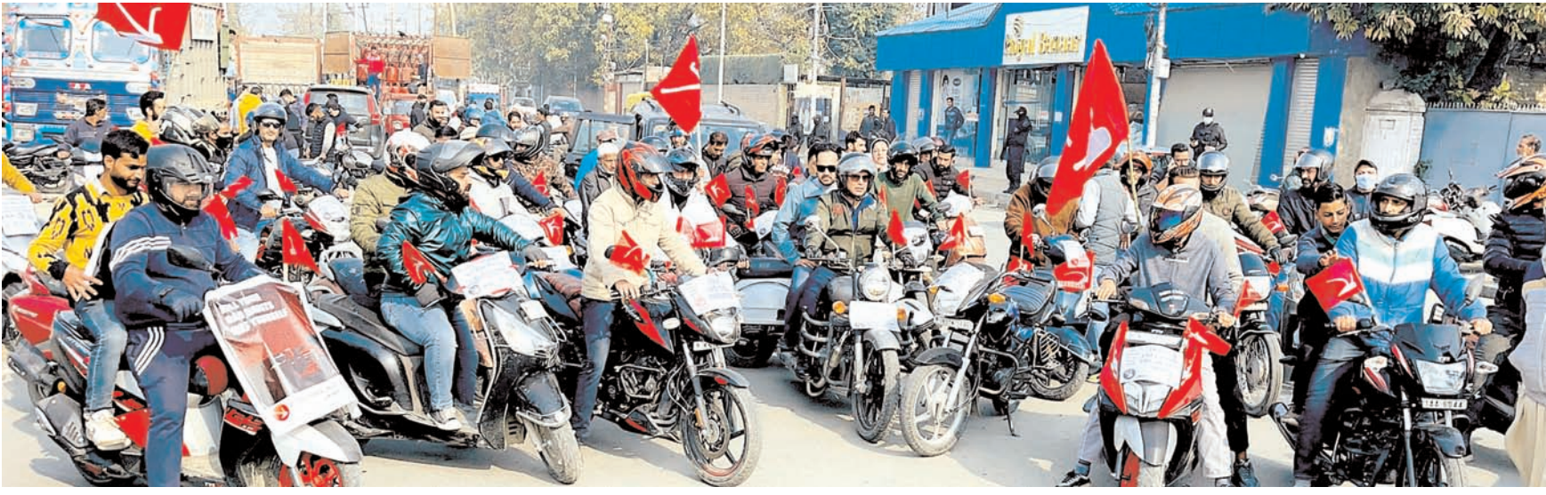
जम्मू-कश्मीर नेशनल कॉन्फ्रेंस ने रविवार को श्रीनगर में समाज में नशीली दवाओं के खतरों के प्रतिकूल प्रभावों के बारे में लोगों को शिक्षित करने के लिए एक मोटरसाइकिल रैली का आयोजन किया।