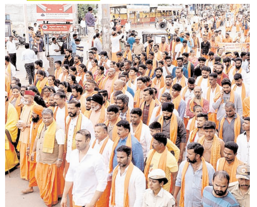
रविवार को चिक्कमगलूरु में दत्तमाला अभियान के तहत श्रीरामसेना के कार्यकर्ताओं ने शोभायात्रा निकाली।