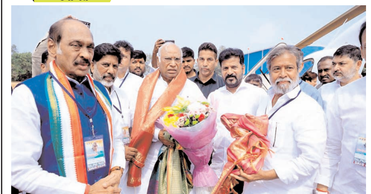
कांग्रेस अध्यक्ष मल्लिकार्जुन खरगे का रविवार को तेलंगाना के संगारेड्डी में एक सार्वजनिक बैठक में एआईसीसी तेलंगाना प्रभारी माणिक राव टाकरे, टीपीसीसी अध्यक्ष रवेत रेड्डी, सीएलपी नेता भट्टी विक्रमार्क और अन्य लोग स्वागत करते हुए।