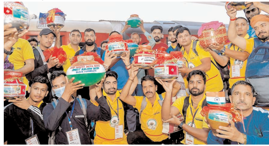
नई दिल्ली में मेरी माटी मेरा देश 2023 अमृत कलश यात्रा जम्मू-कश्मीर से प्रतिनिधिमंडल रविवार को नई दिल्ली रेलवे स्टेशन पर पहुंचा।