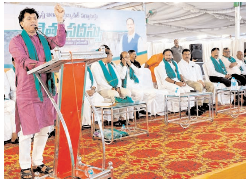
हैदराबाद में केंद्रीय कृषि एवं किसान कल्याण राज्य मंत्री केशवा चौधरी शनिवार को हैदराबाद के प्रदर्शनी मैदान में 'रथसु सदासु' (किसान सम्मेलन) को संबोधित करते हुए।