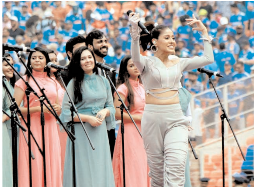
शनिवार को अहमदाबाद के नरेंद्र मोदी स्टेडियम में भारत पाकिस्तान के बीच आईआईसी विश्व कप 2023 मैच के दौरान प्रस्तुति देते बॉलीवुड कलाकार ।