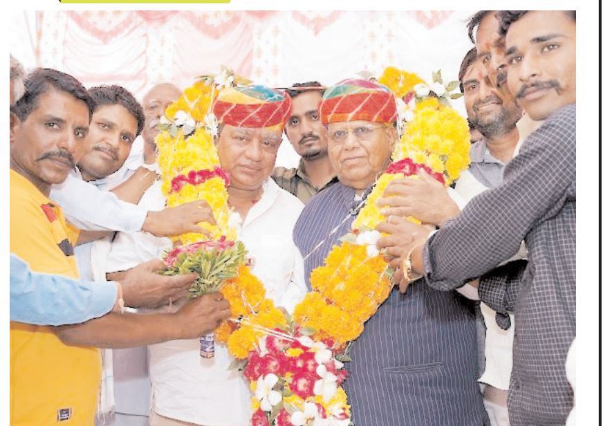
बाली विधानसभा में शनिवार को भाजपा द्वारा जनजातीय सम्मेलन का आयोजन किया गया। जिसमें प्रदेश उपाध्यक्ष चुसीलाल गारसिया, पूर्व मंत्री पुष्पेन्द्र सिंह सहित पार्टी पदाधिकारी उपस्थित रहे।