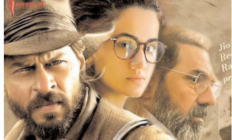
को रिलीज होने वाली है। शुक्रवार (13 अक्टूबर) सुबह मीडिया में इस तरह की अफवाह उड़ी कि 'डंकी' की रिलीज डेट को टाल दिया गया है, लेकिन यह सच नहीं है। मशहूर

चार साल के बाद बड़े परदे पर वापसी करने वाले शाहरुख खान ने 2023 में भारतीय बॉक्स ऑफिस पर 1200 करोड़ का कारोबार करने वाली दो फिल्में पठान और जवान दी हैं। उनकी इस सफलताम वापसी को आगे बढ़ाने का काम करने वाली राजकुमार हिरानी की 'डंकी', जो क्रिसमस के मौके पर 22 दिसम्बर को प्रदर्शित होने जा रही है। बीते दिन इस फिल्म के बारे में समाचार फेला कि राजकुमार हिरानी की शाहरुख खान अभिनीत 'डंकी' 22 दिसम्बर को प्रदर्शित नहीं हो पाएगी। इसे अगले साल के लिए टाल दिया गया है। यह फिल्म साउथ सुपरस्टार प्रभास की फिल्म 'सालार' के साथ इस साल क्रिसमस के मौके पर 22 दिसंबर