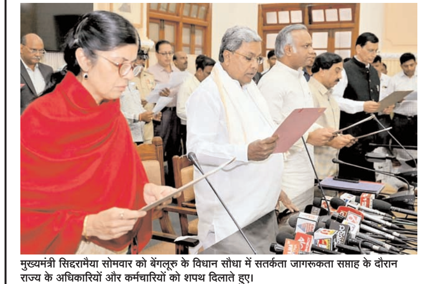
मुख्यमंत्री सिद्धरामैया सोमवार को बेंगलूर के विधान सभा में सतर्कता जागरूकता सप्ताह के दौरान राज्य के अधिकारियों और कर्मचारियों को शपथ दिलाते हुए।