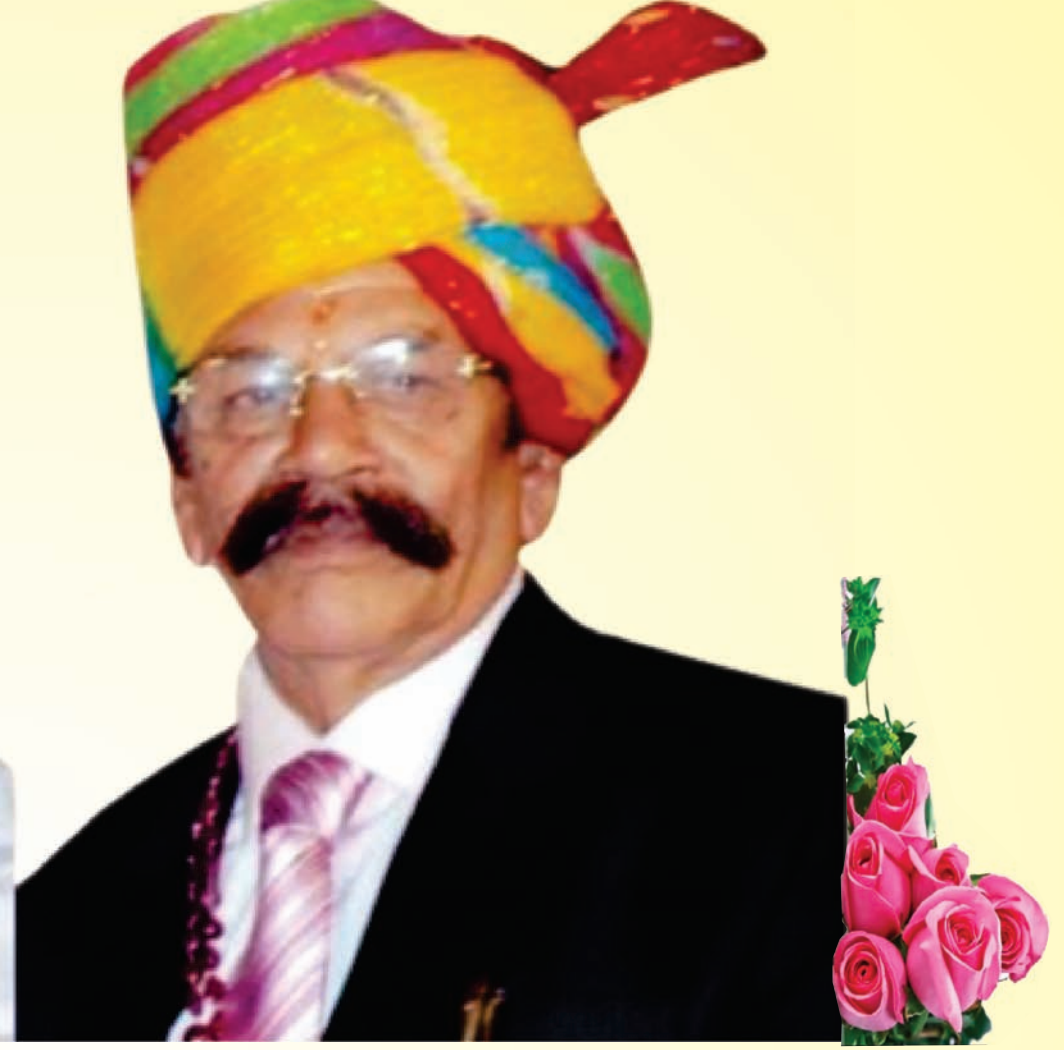
दानवीर, सरलमना, समाजसेवी