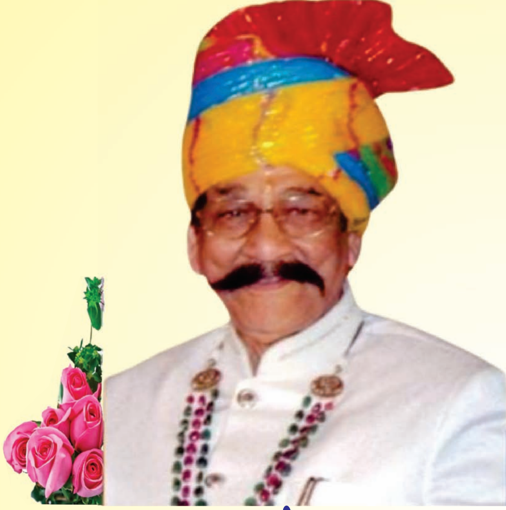
समाज रत्न, दानवीर, भाभाशाह