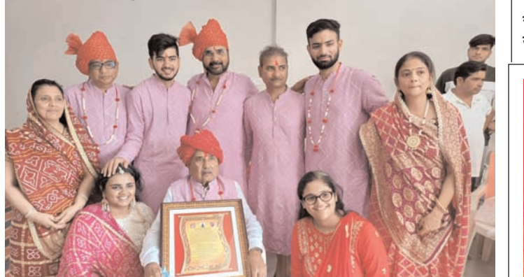
अंजनशालाका प्राण प्रतिष्ठा के मुहूर्त के लाभार्थियों का सम्मान