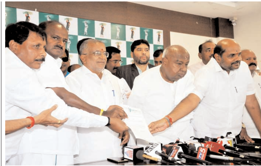
बैठक के दौरान जनता दल एस के वरिष्ठ नेतागण।

पूर्व मुख्यमंत्री एच.डी. कुमारस्वामी ने कहा कि शिवकुमार के तिहाड़ जेल जाने के उनके बयान और अदालत के फैसले के बीच कोई संबंध नहीं है। उन्होंने कहा, शिवकुमार ने कहा था कि वह हमें रामनगर से अपने मूल हासन जिले में जाने के लिए मजबूर करेंगे। मैंने कहा था कि हम हासन वापस जाएंगे और वह तिहाड़ जेल जाएंगे। देखते हैं, क्या होता है।"