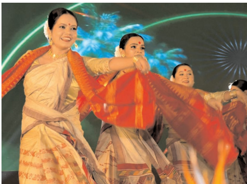
मुंबई में असमिया पारंपरिक बिहू नर्तक मंगलवार रात मुंबई में ग्लोबल मैरीटाइम इंडिया समिट 2023 में प्रदर्शन करते हुए।