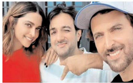
अजीज भी अहम किरदार में नजर आएंगे। यह फिल्म एरियल एक्शन है।

बॉलीवुड अभिनेता ऋतिक रोशन और अभिनेत्री दीपिका पादुकोण की आने वाली फिल्म 'फाइटर' का नया पोस्टर रिलीज हो गया है। फाइटर के निर्देशक सिद्धार्थ आनंद ने पोस्टर शेयर किया है। इस पोस्टर में 100 डेज टू फाइटर और कैप्शन में लिखा, फाइटर 100 दिन में आ रही है। सिद्धार्थ आनंद के निर्देशन में बन रही फिल्म फाइटर में ऋतिक रोशन, दीपिका पादुकोण और अनिल कपूर लीड रोल में नजर आएंगे। इनके अलावा करण सिंह ग्रोवर और तलत