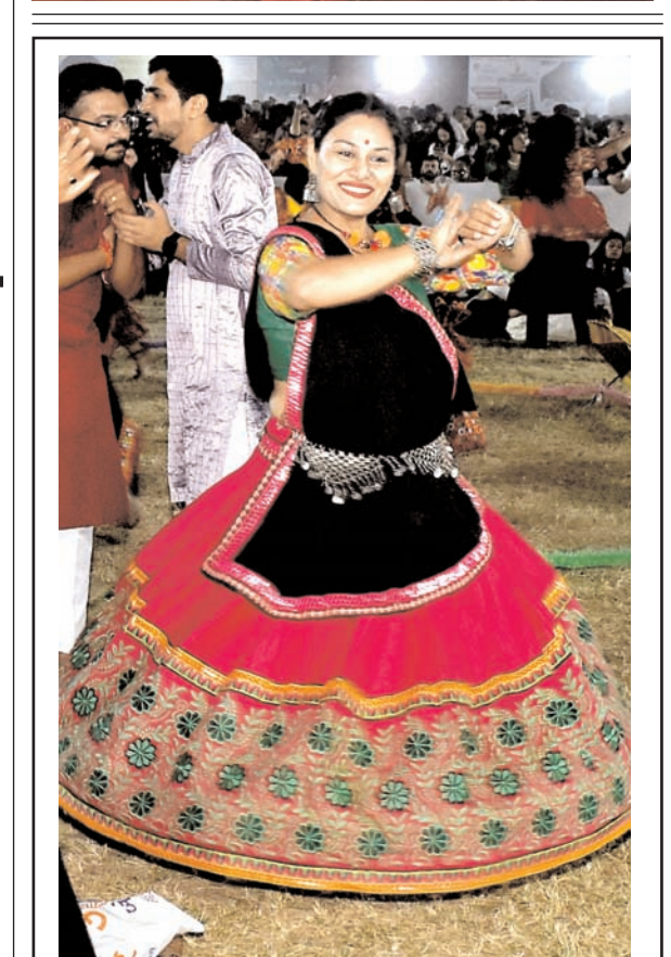
सूरत में बुधवार को नवरात्रि उत्सव के अवसर पर पारंपरिक गरबा नृत्य करती एक महिला।