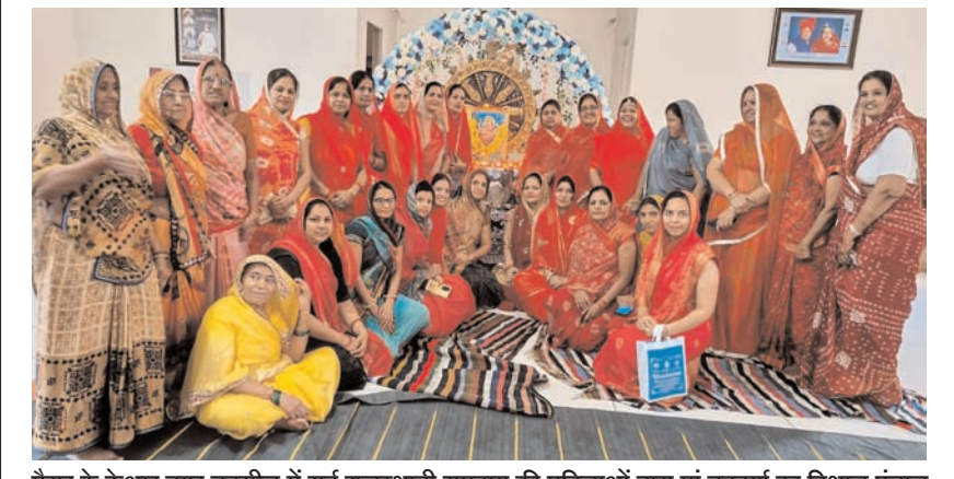
मैसूर के केआर नगर तहसील में सर्व राजस्थानी समुदाय की महिलाओं द्वारा मां नवदुर्गा का विशाल पंडाल सजाकर प्रतिदिन मां भवानी की पूजा कर शाम को डांडिया रास का आयोजन किया जा रहा है जिसमें आसपास के गांवों से बड़ी संख्या में महिलाएं भाग लेने हेतु पहुंच रही हैं।