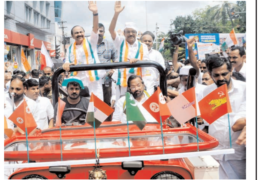
केरल विधानसभा के विपक्षी नेता वीडी सतीशन और आईएमएल नेता पीके कुन्हालीकुडी ने बुधवार को तिरुवनंतपुरम में एलडीएफ सरकार की जनविरोधी नीतियों के विरोध में सचिवालय में एक वाहन रैली निकाली।