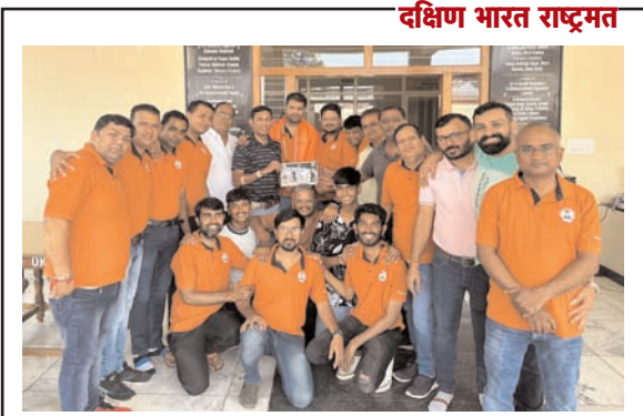
दक्षिण भारत राष्ट्रमत