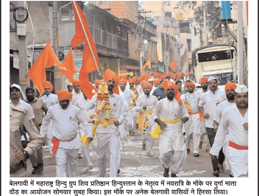
बेलगावी में महाराष्ट्र हिन्दु युव शिव प्रतिष्ठान हिन्दुस्तान के नेतृत्व में नवरात्रि के मौके पर दुर्गा माता दोड़ का आयोजन सोमवार सुबह किया। इस मौके पर अनेक बेलगावी वासियों ने हिस्सा लिया।