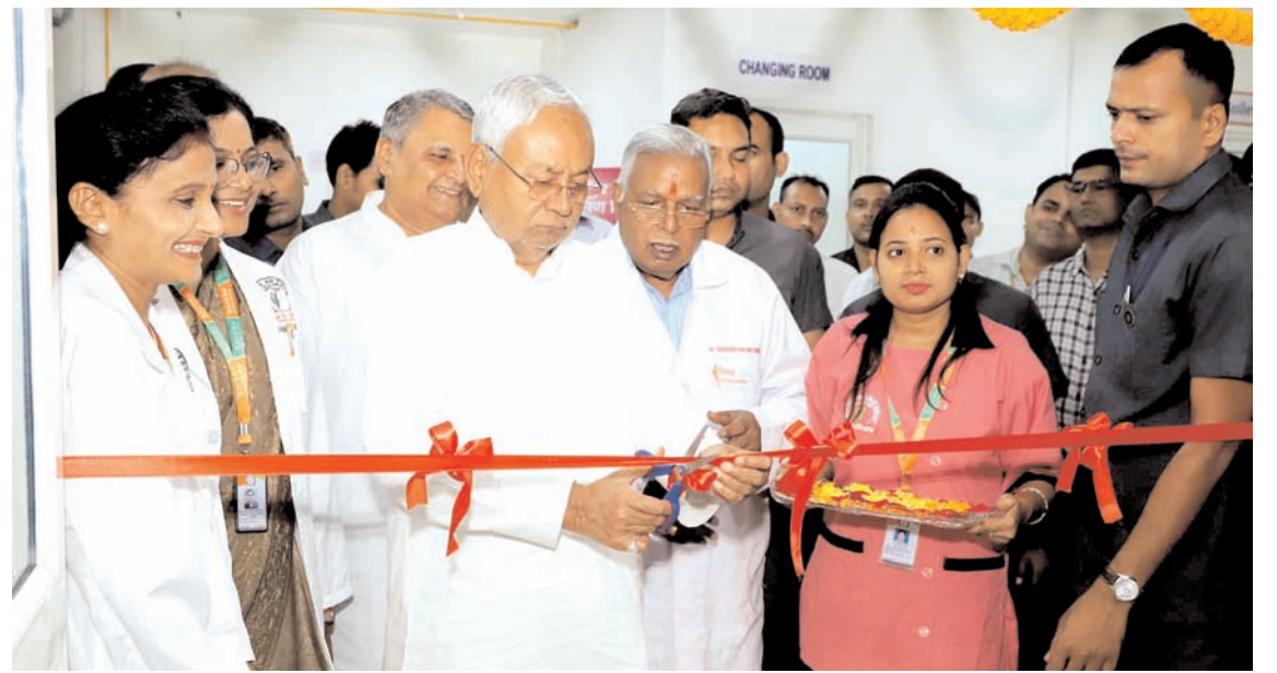
बिहार के मुख्यमंत्री नीतीश कुमार ने सोमवार को पटना के सवेरा कैंसर अस्पताल में रेडिएशन ऑन्कोलॉजी विभाग का उद्घाटन करते हुए।