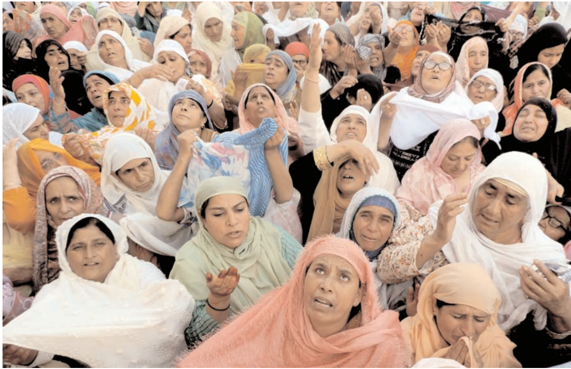
श्रीनगर में शुक्रवार को ईद मिलाद-उन-नब के अवसर पर श्रीनगर के हजरतबल मंदिर में मुख्य पुजारी द्वारा पैगंबर मुहम्मद (एसएडब्ल्यू) के पवित्र अवशेष को प्रदर्शित करते समय श्रद्धालु प्रार्थना करते हुए।