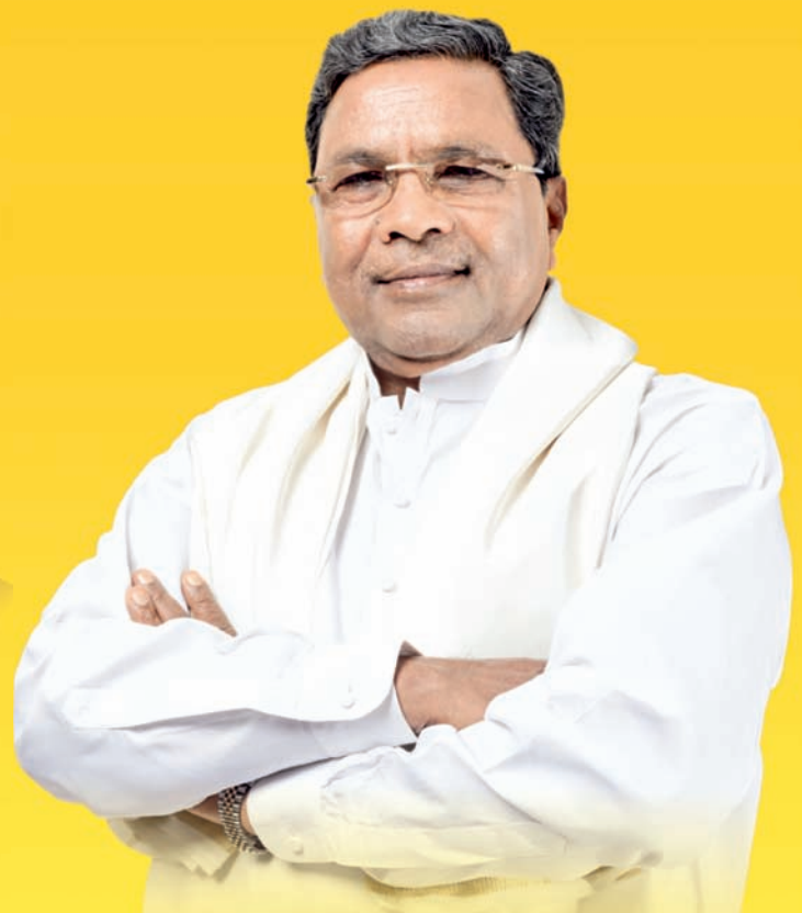
Sri Siddaramaiah Hon'ble Chief Minister