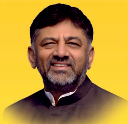
Sri D. K. Shivakumar Hon'ble Deputy Chief Minister