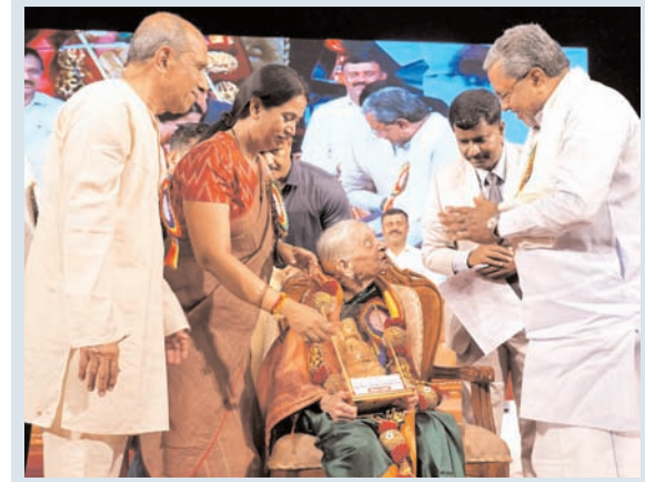
मुख्यमंत्री सिद्धरामैया ने रविवार को बंगलूरु के रवींद्र कलाक्षेत्र में बुजुर्ग दिवस का उद्घाटन किया और वरिष्ठ नागरिकों को सम्मानित किया। मंत्री लक्ष्मी हेब्बलकर और अन्य लोग नजर आ रहे हैं।

जद (एस) के प्रदेश अध्यक्ष सी. एम. इब्राहिम ने भी भाजपा के साथ गठबंधन पर असंतोष व्यक्त करते हुए कहा है कि उनसे सलाह नहीं ली गई और वह आने वाले दिनों में अपने भविष्य के बारे में फैसला लेंगे। पिछले कुछ दिनों से पार्टी की बैठकों में शामिल नहीं हो रहे पूर्व केंद्रीय मंत्री इब्राहिम ने आज की बैठक में भी हिस्सा नहीं लिया। वह पिछले साल कांग्रेस और विधान परिषद सदस्यता से इस्तीफा देने के बाद जद (एस) में शामिल हो गए थे। भाजपा के साथ गठबंधन के बाद कांग्रेस जद (एस) पर हमलावर है और उसकी धर्मनिरपेक्ष साख पर सवाल उठा रही है।