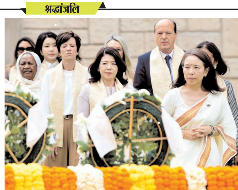
नई दिल्ली में रविवार को जी20 प्रमुखों के जीवनसाथी नई दिल्ली में राजघाट पर महात्मा गांधी की समाधि पर श्रद्धांजलि अर्पित करते हुए।

रविवार दोपहर में होनोई पहुंचे बाइडन ने पिछले महीने साउथ लेक रिटी में एक 'फंड रेज' कार्यक्रम में कहा था कि वियतनाम अमेरिका के साथ रक्षा साझेदारी नहीं चाहता है, लेकिन यह संबंध चाहता है क्योंकि यह चीन को बताना चाहता है कि वह अकेला नहीं है और अपना साझेदार स्वयं चुन सकता है।