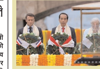
'शिखर सम्मेलन ने साबित कर दिया कि जी20 सबसे अहम मुद्दों का अब भी समाधान निकाल सकता है'

नई दिल्ली/भाषा। रक्षा मंत्री राजनाथ सिंह ने कहा कि भारत की जी20 समूह की अध्यक्षता ने विश्व मंच पर 'अभिष्ट छाप' छोड़ी है और इस दौरान नई दिल्ली घोषणापत्र (नई दिल्ली लीडर्स समिट डिक्लेरेशन) पर आम सहमति बनना दुनिया में विश्वास की कमी को पाटने की दिशा में ऐतिहासिक मील का पत्थर है। राजनाथ सिंह ने प्रधानमंत्री मोदी की सराहना करते हुए कहा कि उन्होंने 'विश्व गुरु' और 'विश्व बंधु' दोनों रूपों में 'भारत के कौशल को सफलतापूर्वक प्रदर्शित किया है। रक्षा मंत्री सिंह ने 'एक्स' पर लिखा, 'नई दिल्ली में ऐतिहासिक जी20 शिखर सम्मेलन सफलतापूर्वक समाप्त हुआ। प्रधानमंत्री नरेन्द्र मोदी के नेतृत्व में भारत की अध्यक्षता में हुई इस बैठक ने विश्व मंच पर अभिष्ट छाप छोड़ी है।'