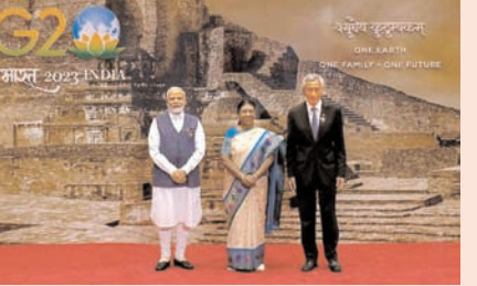
अधिकारियों ने कहा कि नालंदा विश्वविद्यालय विविधता, योग्यता, विचार की स्वतंत्रता, सामूहिक शासन, स्वायत्तता और ज्ञान साझाकरण का प्रतिनिधित्व करता है - ये सभी लोकतंत्र के मूल सिद्धांतों के अनुरूप हैं। उन्होंने कहा कि नालंदा भारत की उत्तम शैक्षिक खोज की स्थायी भावना और भारत के जी20 प्रेसीडेंसी थीम वसुधैव कुटुम्बकम् के अनुरूप एक सामंजस्यपूर्ण विश्व सन्तुल्य के निर्माण की प्रतिबद्धता का जीता जाता प्रमाण है। शाम के स्वागत समारोह की पुष्पभूमि में नालंदा था, तो सुबह में भारत का कोणार्क चक्र फोकस में रहा। प्रधानमंत्री ने भारत मंडप में शिखर सम्मेलन की शुरुआत से पहले जी20 नेताओं का अभिवादन किया तो पुष्पभूमि में ओडिशा के कोणार्क सूर्य मंदिर की एक सुंदर छवि दिखी।

नई दिल्ली/भाषा। ओडिशा के 13वीं सदी के कोणार्क मंदिर से लेकर बिहार के प्राचीन नालंदा विश्वविद्यालय तक यहां जी20 शिखर सम्मेलन स्थल में भारत की समृद्ध स्थापत्य विरासत को प्रमुखता से पेश किया गया। राष्ट्रपति द्रौपदी मुर्मू और प्रधानमंत्री नरेन्द्र मोदी ने शनिवार रात 'भारत मंडप' स्थल पर विभिन्न राष्ट्राध्यक्षों और अन्य विश्व नेताओं और उनके जीवनसाथियों के लिए एक औपचारिक रात्रिभोज में मेहमानों का स्वागत किया जहां यूनेस्को के विश्व धरोहर स्थल - प्राचीन नालंदा विश्वविद्यालय की प्रतिकृति प्रमुखता से नजर आई। नालंदा विश्वविद्यालय दुनिया के सबसे प्राचीन विश्वविद्यालयों में से एक है। मेहमानों का अभिवादन करते समय प्रधानमंत्री मोदी को ब्रिटेन के प्रधानमंत्री ऋषि सुनक सहित जी20 के कुछ नेताओं को विश्वविद्यालय के महत्व के बारे में बताते हुए भी देखा गया।