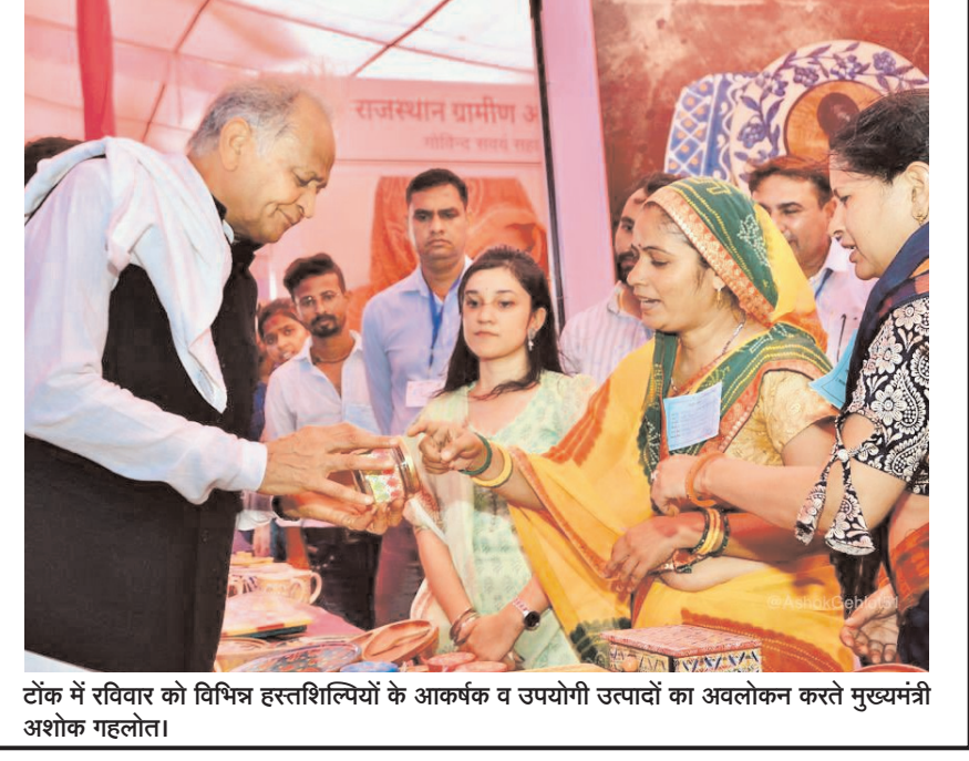
टोंक में रविवार को विभिन्न हस्तशिल्पियों के आकर्षक व उपयोगी उत्पादों का अवलोकन करते मुख्यमंत्री अशोक गहलोट।