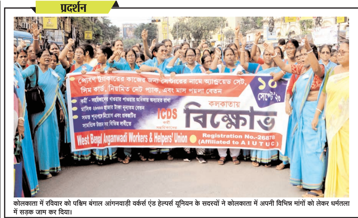
कोलकाता में रविवार को पश्चिम बंगाल आंगनवाड़ी वर्कर्स एंड हेल्पर्स यूनियन के सदस्यों ने कोलकाता में अपनी विभिन्न मांगों को लेकर धर्मतला में सड़क जाम कर दिया।