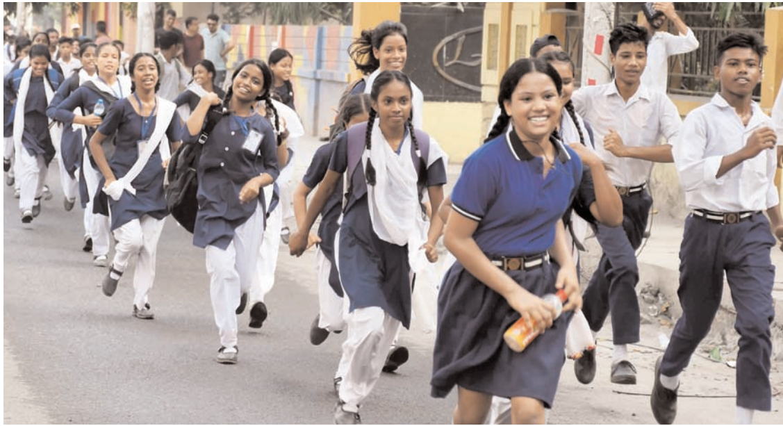
पटना में रविवार को संयुक्त रक्षा सेवा (सीडीएस) परीक्षा देने के बाद अभ्यर्थी परीक्षा केंद्र से बाहर निकलते हुए।