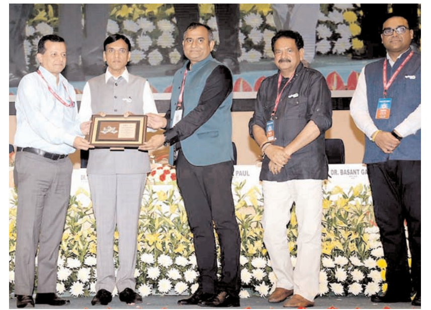
केंद्रीय स्वास्थ्य एवं परिवार कल्याण, रसायन एवं उर्वरक मंत्री मनसुख मंडाविया बुधवार को नई दिल्ली के विज्ञान भवन में आरोग्य मंथन 2023 के समापन सत्र में शामिल हुए।