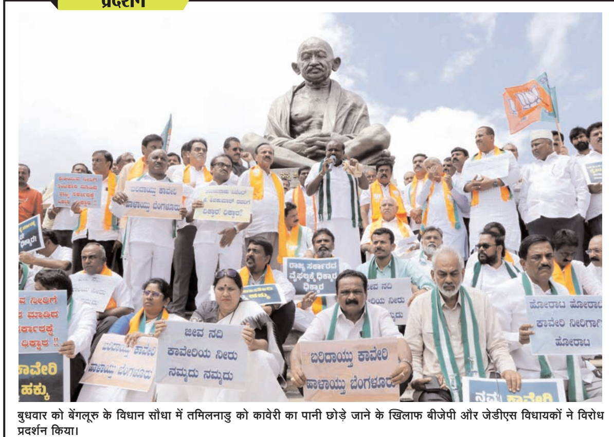
बुधवार को बंगलूर के विधान सौंधा में तमिलनाडु को कावेरी का पानी छोड़े जाने के खिलाफ बीजेपी और जेडीएस विधायकों ने विरोध प्रदर्शन किया।