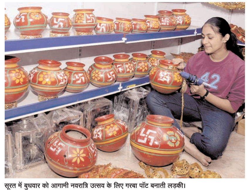
सूरत में बुधवार को आगामी नवरात्रि उत्सव के लिए गरबा पाँट बनाती लड़की।