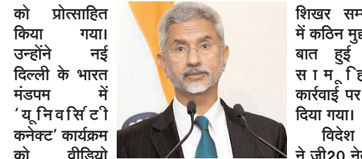
शिखर सम्मेलन में कठिन मुद्दों पर बात हुई और सात नई दिल्ली के भारत मंडप में 'यूनिवर्सिटी कनेक्ट' कार्यक्रम को वीडियो कॉन्फ्रेंस के माध्यम से संबोधित करते हुए यह बात कही। जयशंकर 78वें संयुक्त राष्ट्र महासभा सत्र में भाग लेने के लिए अभी न्यूयॉर्क में हैं। जयशंकर ने कहा कि भारत की जी20 अध्यक्षता के दौरान

न्यूयॉर्क/भाषा। विदेश मंत्री एस. जयशंकर ने मंगलवार को कहा कि इस साल जी20 की अध्यक्षता के दौरान, भारत उत्तर-दक्षिण विभाजन और पूर्व-पश्चिम ध्रुवीकरण को पाटने में सफल रहा और दुनिया के सबसे शक्तिशाली देशों को मानवता के सामने आने वाली चुनौतियों का सामना करने तथा उनके हल के लिए प्रतिबद्ध होने