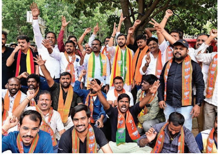
कावेरी जल मुद्दे पर मंगलवार को भाजपा कार्यकर्ताओं ने बेंगलूरु के फ्रीडम पार्क में विरोध प्रदर्शन किया।