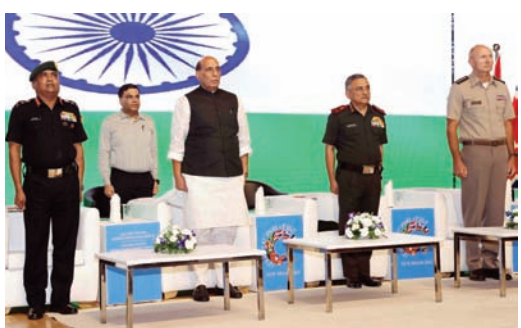
हिंद-प्रशांत क्षेत्र की जटिलताएं दूर करने के लिए सामूहिक प्रयास जरूरी : राजनाथ

नई दिल्ली/भाषा। रक्षा मंत्री राजनाथ सिंह ने हिंद-प्रशांत क्षेत्र की जटिलताओं से निपटने और क्षेत्र में समृद्धि, सुरक्षा तथा समावेशी भविष्य सुनिश्चित करने के लिए मंगलवार को 'सामूहिक प्रयास' करने का आह्वान किया।