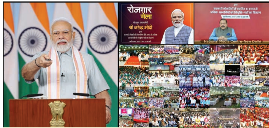
मोदी ने विभिन्न सरकारी विभागों में 51,000 से अधिक नवनि्युक्त कर्मचारियों को नियुक्ति पत्र वितरित किए।

मोदी ने विभिन्न सरकारी विभागों में 51,000 से अधिक नवनि्युक्त कर्मचारियों को नियुक्ति पत्र वितरित करने के बाद सीडियो कॉन्फ्रेंस के माध्यम से एक रोजगार मेले को संबोधित करते हुए शासन में प्रौद्योगिकी के बढ़ते उपयोग पर भी जोर दिया। उन्होंने नवनि्युक्त कर्मचारियों से कहा कि सरकारी योजनाओं में प्रौद्योगिकी के उपयोग से भ्रष्टाचार और जटिलताओं पर