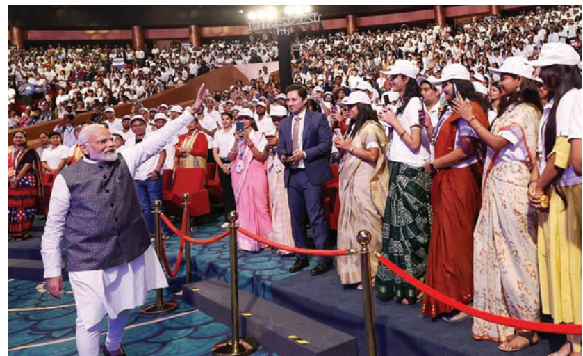
प्रधानमंत्री मंगलवार को नई दिल्ली के प्रगति मैदान में भारत मंडप में जी20 यूनिवर्सिटी कनेक्ट फिनान्सेल में शामिल हुए।