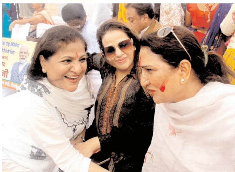
शुक्रवार को नई दिल्ली में भाजपा मुख्यालय में महिला आरक्षण विधेयक 2023 के पारित होने के जश्न के दौरान भाजपा सांसद भाजपा महिला मोर्चा के सदस्यों के साथ।