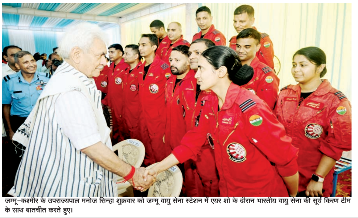
जम्मू-कश्मीर के उपराज्यपाल मनोज सिन्हा शुक्रवार को जम्मू वायु सेना स्टेशन में एयर शो के दौरान भारतीय वायु सेना की सूर्य किरण टीम के साथ बातचीत करते हुए।