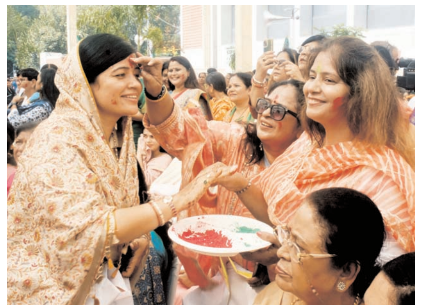
नई दिल्ली में भाजपा महिला मोर्चा ने शुक्रवार को भाजपा मुख्यालय में महिला आरक्षण विधेयक 2023 के पारित होने का जश्न मनाते हुए।