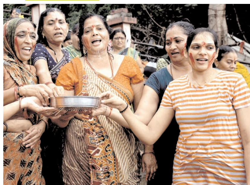
सूरत में बुधवार को 'ऋषि पंचमी' के अवसर पर तापी नदी के संगम पर पवित्र रान करने के बाद अनुष्ठान करते श्रद्धालु।