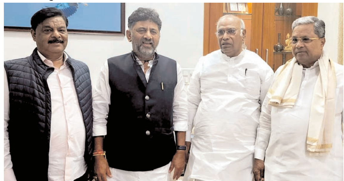
बुधवार को नई दिल्ली में एआईसीसी अध्यक्ष मन्विकार्जुन खरगे से मुलाकात करते हुए मुख्यमंत्री सिद्धरामैया, उपमुख्यमंत्री डीके शिवकुमार, मंत्री डॉ. एचसी महादेवप्पा।