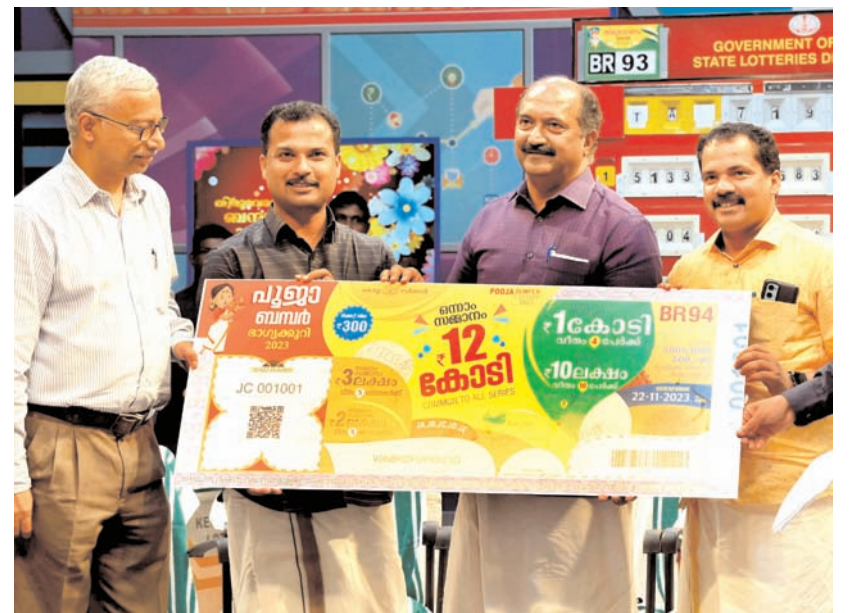
केरल के वित्त मंत्री के एन बालगोपाल ने बुधवार को तिरुवनंतपुरम में केरल राज्य लाटरी विभाग की 12 करोड़ की केरल राज्य पूजा बम्पर लाटरी टिकट जारी करते हुए।