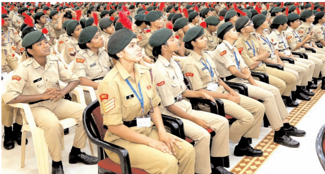
नई दिल्ली में बुधवार को 17 एनसीसी निदेशालयों के एनसीसी केडेट बुधवार को दिल्ली कैंट के करियप्पा परेड ग्राउंड में अखिल भारतीय थल सैनिक शिबिर के उद्घाटन के अवसर पर।