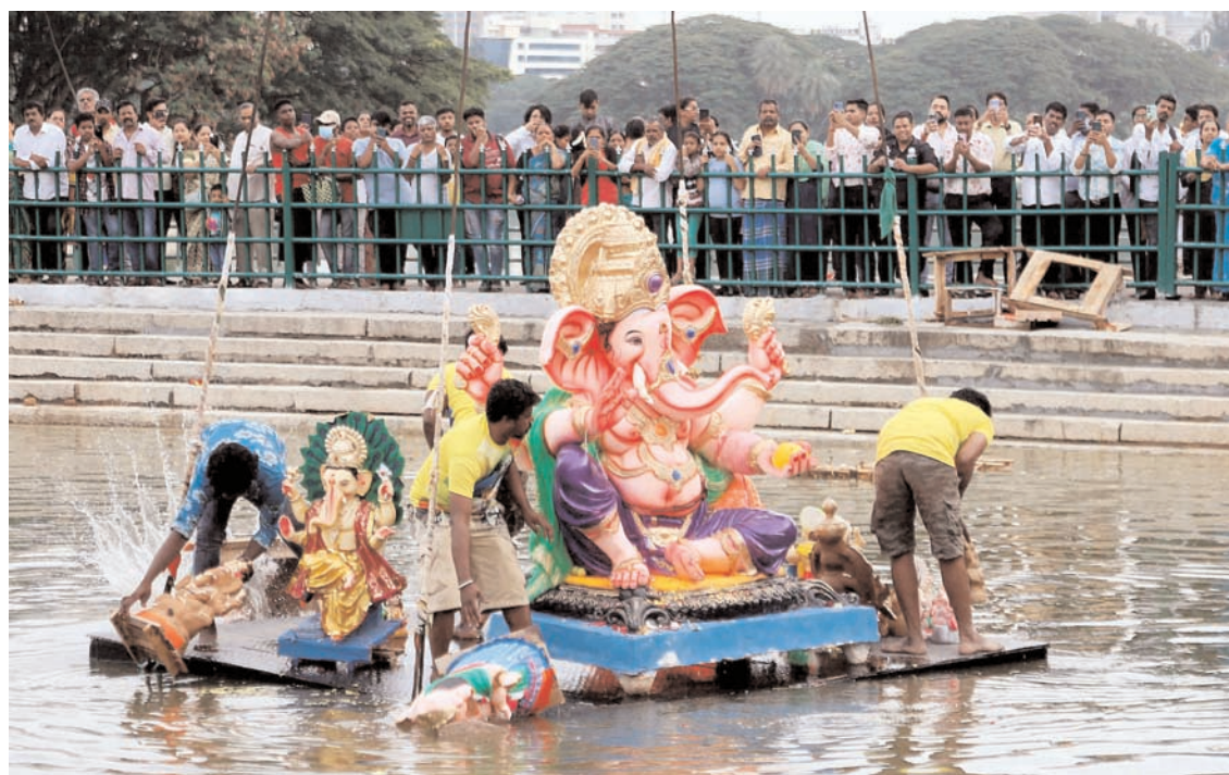
बुधवार को बंगलूरु की अलसूर झील में बने विशेष कल्याणी में गणेश प्रतिमाओं का विसर्जन को देखते हुए लोग।