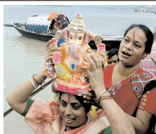
गणेश की मूर्ति को गंगा में विसर्जित

मुंबई/वार्ता। बॉलीवुड अभिनेत्री करीना कपूर फिल्म सिंघम अगेन में काम करती नजर आ सकती हैं। जाने-माने निर्देशक रोहित शेट्टी ने सिंघम अगेन की शूटिंग शुरू कर दी है। इस फिल्म के जरिये अजय देवगन सिंघम के रूप में वापस आएंगे, उनके साथ रणवीर सिंह सिम्बा और अक्षय कुमार सूर्यवंशी के रूप में शामिल होंगे। चर्चा है कि करीना कपूर सिंघम रिटर्न्स के अपने टुक को जारी रखते हुए, अजय देवगन की पत्नी की भूमिका निभाने के लिए सिंघम फ्रेंचाइजी में वापस आ गई है। वह फिल्म में एक बहुत ही महत्वपूर्ण भूमिका निभाती हूंगी नजर आयेगी। सिंघम अगेन की शूटिंग अगले छह महीनों की अवधि में भारत और विदेशों में की जाएगी।