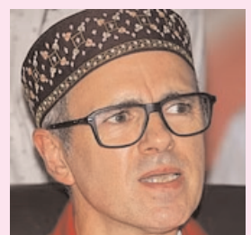
प्रधानमंत्री जस्टिन ट्रूडो के आरोपों पर चिंता व्यक्त की और कहा कि इससे दोनों देशों के बीच बहुत मजबूत द्विपक्षीय संबंधों को नुकसान पहुंचाने का खतरा है। उमर ने कहा, ...उनका (ट्रूडो) दावा है कि यह बात जांच पर आधारित है। बेहतर होता कि वह जांच पूरी होने तक इंतजार करते। अगर उनके पास अपने दावे का समर्थन करने के लिए सबूत हैं, तो मैं विनम्रतापूर्वक उन्हें सुझाव दूंगा कि वह इन

अब्दुल्ला ने यहां पार्टी मुख्यालय में पत्रकारों से कहा, हमने हमेशा भारत और पाकिस्तान के बीच बातचीत का समर्थन किया है, लेकिन उनके बीच बातचीत फिर से शुरू करने के लिए अनुकूल माहौल की आवश्यकता है। यह न केवल भारत की जिम्मेदारी है, बल्कि पाकिस्तान पर भी यह जिम्मेदारी है कि वह बातचीत के लिए अनुकूल माहौल बनाए। उन्होंने जून में कनाडा में एक खालिस्तानी अलगाववादी नेता की हत्या में भारतीय एजेंट की संभावित संलिप्तता के कनाडा के