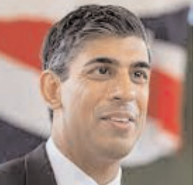
विचार कर रहे हैं, जो वर्तमान में 2030 के लिए निर्धारित है। इसी तरह, घरों को गर्म करने के लिए नई प्राकृतिक गैस पर रोक की समयसीमा भी बढ़ाने पर विचार किया जा रहा है, जो वर्तमान में 2035 के लिए निर्धारित है। सुनक ने कहा कि वह पर्यावरण के प्रति एक "आनुपातिक" दृष्टिकोण अपनाएंगे। बुधवार दोपहर के लिए निर्धारित भाषण से पहले योजनाओं पर चर्चा करने के लिए उन्होंने

ब्रिटेन के प्रधानमंत्री ऋषि सुनक ने बुधवार को जलवायु परिवर्तन संबंधी कुछ प्रतिबद्धताओं से पीछे हटने के संकेत दिए। उन्होंने कहा कि ब्रिटेन को हर हाल में जलवायु परिवर्तन के खिलाफ लड़ना चाहिए, लेकिन शर्मिंदगी और उपभोक्ताओं पर इसका प्रभाव पड़े बिना ऐसा किया जाना चाहिए। इस खबर की राजनीतिक विरोधियों, पर्यावरण समूहों और ब्रिटिश उद्योग के बड़े हिस्से ने व्यापक आलोचना की, लेकिन सत्ताधारी केंजरेटिव पार्टी के कुछ वर्गों ने इस कदम का स्वागत किया है। सुनक ने बीबीसी की एक रिपोर्ट पर प्रतिक्रिया देते हुए मंगलवार देर रात एक बयान जारी किया, जिसमें कहा गया है कि प्रधानमंत्री नई गैसोलीन और डीजल कारों पर प्रतिबंध की समय सीमा बढ़ाने पर