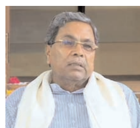
अपील की और कहा कि कर्नाटक, तमिलनाडु को 5000 क्यूसेक पानी में से 2500 क्यूसेक जारी करने पर राजी हो गया है।

सिद्धरामैया और उपमुख्यमंत्री डी के शिवकुमार इस मामले पर चर्चा करने के लिए जलशक्ति मंत्री से मिल सकते हैं। इस बीच, वरिष्ठ भाजपा नेता और केंद्रीय मंत्री प्रह्लाद जोशी ने कर्नाटक की कांग्रेस सरकार से इस मामले का राजनीतिकरण नहीं करने की