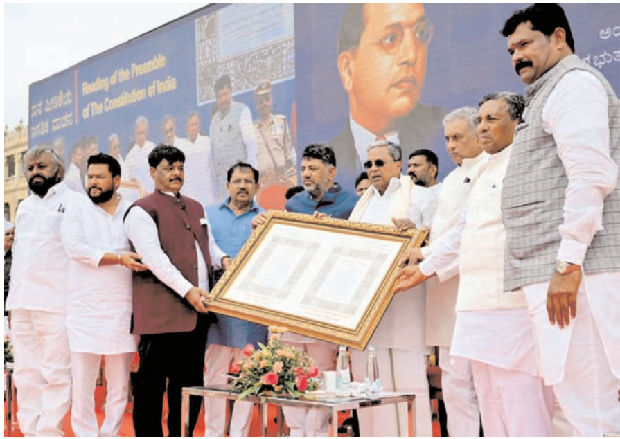
शुक्रवार को बेंगलूर के विधान सौधा में अंतरराष्ट्रीय लोकतंत्र दिवस के हिस्से के रूप में 'संविधान की प्रस्तावना पढ़ें' कार्यक्रम में भाग लेते हैं मुख्यमंत्री सिद्धरामैया, उपमुख्यमंत्री डीके शिवकुमार, समाज कल्याण मंत्री डॉ. एचसी महादेवप्पा एवं अन्य।