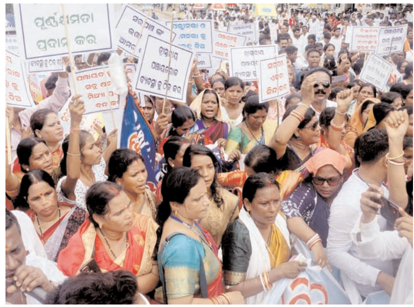
ओडिशा सरपंच महासंघ (ओएसएम)-सीधे निर्वाचित प्रतिनिधि) के सदस्य शुक्रवार को भुवनेश्वर में अपनी 15 पॉपिट चार्टर मांगों को लेकर प्रदर्शन करते हुए।