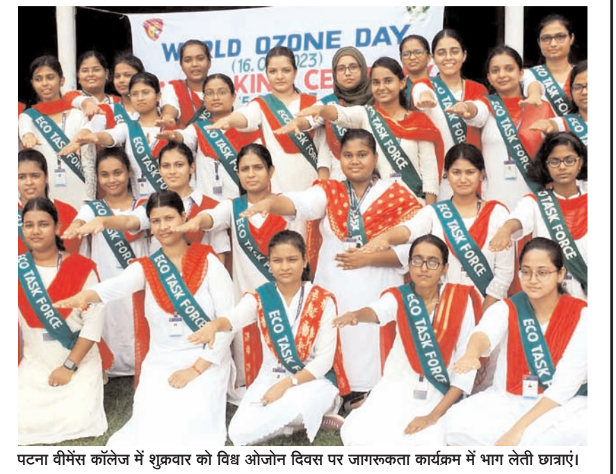
पटना वीमेंस कॉलेज में शुक्रवार को विश्व ओजोन दिवस पर जागरूकता कार्यक्रम में भाग लेती छात्राएं।