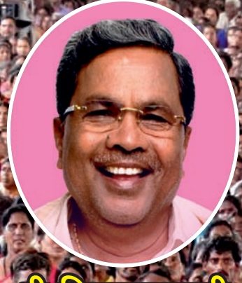
श्री सिद्धरामय्याजी माननीय मुख्यमंत्री