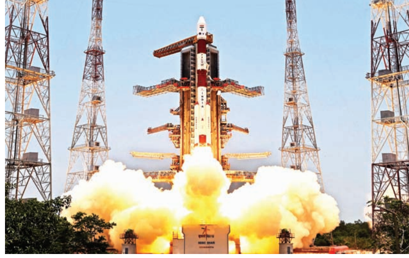
चांद पर विजय के बाद सूर्य की ओर कूच

चीन में तूफान 'साओला' की दस्तक, नौ लाख लोग सुरक्षित स्थानों पर पहुंचाए गए बीजिंग/एपी। दक्षिणी चीन में शनिवार सुबह तूफान 'साओला' ने दस्तक दी। चेतवनी को देखते हुए एक दिन पहले ही लगभग नौ लाख लोगों को सुरक्षित स्थानों पर पहुंचा दिया गया था। इसके अलावा तूफान के चलते हांगकांग के अधिकतर हिस्से और तटीय दक्षिणी चीन के अन्य हिस्सों में व्यापारिक गतिविधियां, परिवहन सेवा और स्कूल बंद कर दिए गए। हांगकांग के ठीक दक्षिण में झुहाई शहर में रात तीन बजकर 30 मिनट यह शक्तिशाली तूफान आया।