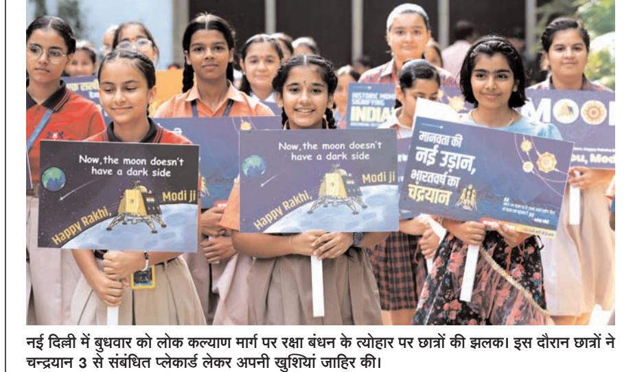
नई दिल्ली में बुधवार को लोक कल्याण मार्ग पर रक्षा बंधन के त्योहार पर छात्रों की झलक। इस दौरान छात्रों ने चन्द्रयान 3 से संबंधित प्लेकार्ड लेकर अपनी खुशियां जाहिर की।