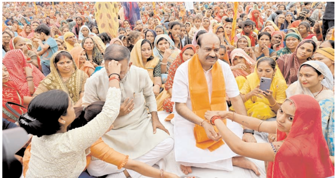
कोटा में मंगलवार को सांगोद के दूधिया खेड़ी में बहनों से रक्षा सूत्र बंधवाते लोकसभा अध्यक्ष ओम बिरला।