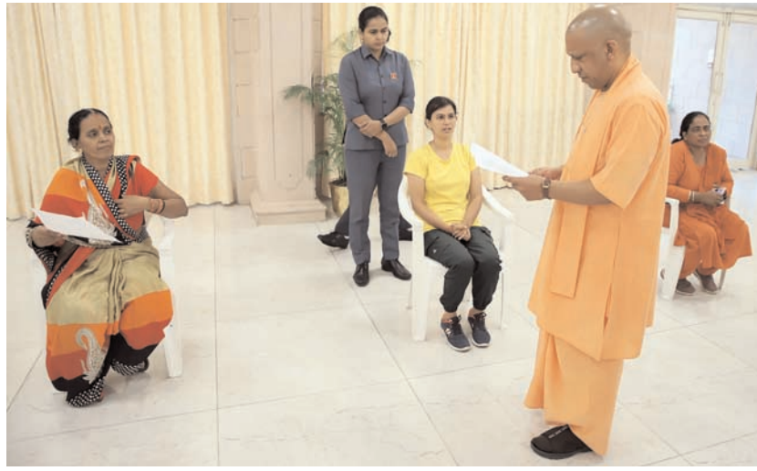
उत्तर प्रदेश के मुख्यमंत्री योगी आदित्यनाथ मंगलवार को लखनऊ में जनता दरबार में शामिल हुए एवं जन समस्याओं को सुनकर अधिकारियों को निर्देश दिये।