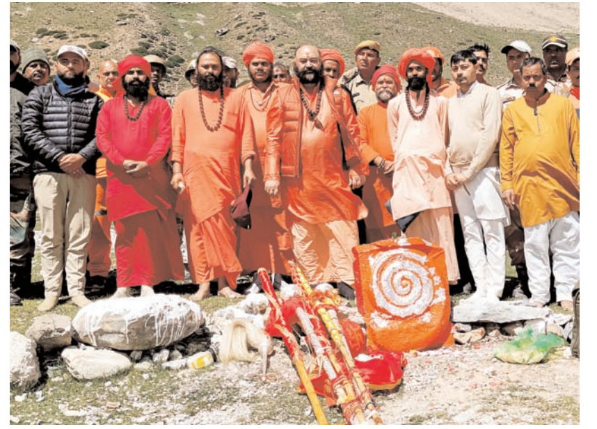
श्रीनगर में मंगलवार को छड़ी मुबारक शेषनाग पहुंची और झील के तट पर पूजन किया गया। छड़ी मुबारक कल सुबह पंजतरणी के लिए रवाना होगी और मंगलवार को अमरनाथ में पवित्र गुफा मंदिर पहुंचेगी।