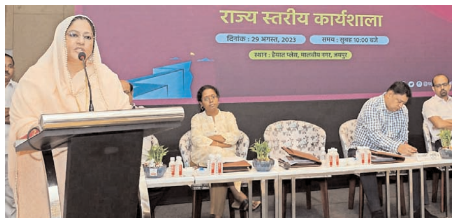
राज्य स्तरीय कार्यशाला