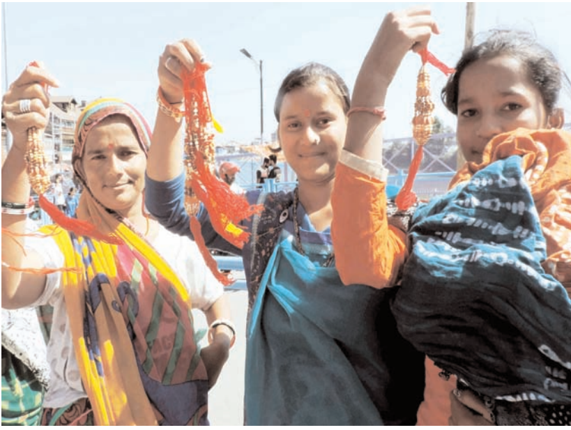
श्रीनगर में मंगलवार को रक्षा बंधन की पूर्व संध्या पर लोग राखियों खरीदते हुए।