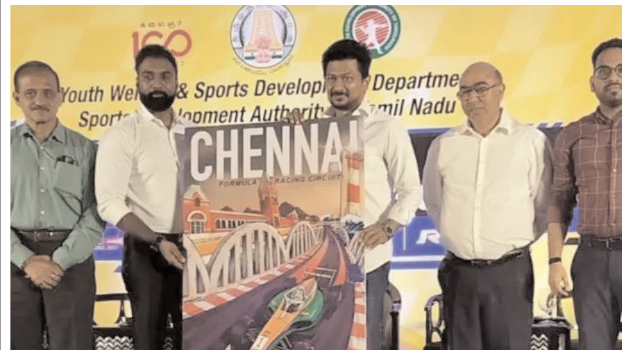
दक्षिण भारत राष्ट्रमत dakshinbharat.com

वेन्नई। तमिलनाडु सरकार और रेसिंग प्रमोशंस प्राइवेट लिमिटेड (आरपीपीएल) ने बुधवार को यहां एक नए सर्किट का अनावरण किया