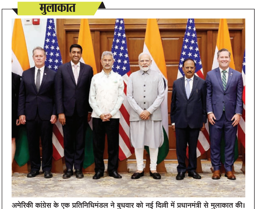
अमेरिकी कांग्रेस के एक प्रतिनिधिमंडल ने बुधवार को नई दिल्ली में प्रधानमंत्री से मुलाकात की।