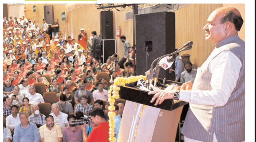
जयपुर में शनिवार को लोकसभा अध्यक्ष ओम बिरला भगवान महावीर केंसर हॉस्पिटल एंड रिसर्च इंस्टीट्यूट द्वारा आयोजित कार्यक्रम में केंसर रोग विजेताओं से भेंट कर उन्हें इस गंभीर बीमारी से लड़ने की सशक्त प्रेरणा दी।