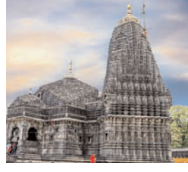
दक्षिण भारत राष्ट्रमत dakshinbharat.com

सितंबर तक बंद कर दिया है। एक अधिकारी ने शनिवार को यह जानकारी दी। श्री खंबकेश्वर देवस्थान न्यास ने एक विज्ञप्ति में कहा, माघमास के दौरान मंदिर में श्रद्धालुओं की बड़ी भीड़ के मद्देनजर सभी तरह के वीआईपी दर्शन 15 सितंबर तक बंद रहेंगे। लेकिन अति महत्वपूर्ण व्यक्तियों (वीआईपी) के लिए प्रोटोकॉल के संबंध में केंद्रीय स्तर, राज्य स्तर और जिला कलेक्टर द्वारा लिखित पत्राचार पर यह पाबंदी लागू नहीं होगी। न्यास कार्यालय के एक अधिकारी ने कहा कि इस अवधि के दौरान भक्तों के लिए 200 रुपए की कीमत पर उपलब्ध वीआईपी दर्शन की सुविधा बंद रहेगी।