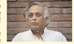
नई दिल्ली/भाषा। कांग्रेस ने मंगलवार को आरोप लगाया कि केंद्र सरकार की जनविरोधी नीतियों के कारण महंगाई आसमान छू रही है।