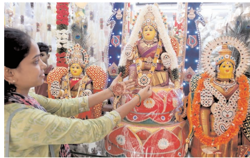
बैंगलूरु के मल्लेश्वरम् में मंगलवार को वरमहालक्ष्मी व्रत के लिए महिलाएं खरीदारी करती हुईं। 25 अगस्त को कर्नाटक में वरमहालक्ष्मी का त्यौहार बहुत ही धूमधाम से मनाया जाता है।