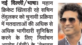
नई दिल्ली/भाषा। महान क्रिकेट खिलाड़ी रहे सचिन तेंदुलकर को चुनावी प्रक्रिया में मतदाताओं की अधिक से अधिक भागीदारी सुनिश्चित करने के लिए निर्वाचन आयोग (ईसी) के 'नेशनल आइकन' के रूप में नामित किया जाएगा।

तेंदुलकर और चुनाव आयोग के बीच समझौता ज्ञापन पर हस्ताक्षर किए जाएंगे। 3 साल के समझौते के तहत तेंदुलकर मतदाताओं में जागरूकता का प्रसार करेंगे। आयोग ने बयान में कहा, यह सहयोग चुनावों, विशेष रूप से 2024 के लोकसभा चुनाव में मतदाताओं की भागीदारी बढ़ाने के लिए युवाओं के बीच तेंदुलकर के अद्वितीय प्रभाव का लाभ उठाने की दिशा में महत्वपूर्ण कदम होगा। निर्वाचन आयोग ने इस साझेदारी के माध्यम से मतदान के प्रति शहरी लोगों और युवाओं की उदासीनता संबंधी चुनौतियों से निपटना चाहता है। आयोग मतदाताओं को चुनावी प्रक्रिया में भाग लेने के लिए प्रेरित करने के मकसद से विभिन्न क्षेत्रों की मशहूर हस्तियों को अपने 'नेशनल आइकन' के रूप में नामित करता रहा है। पिछले साल आयोग ने अभिनेता पंकज त्रिपाठी को 'नेशनल आइकन' के रूप में मान्यता दी थी। इससे पहले 2019 के लोकसभा चुनाव के दौरान एमएस धोनी, आमिर खान और मेरी कॉम जैसे दिग्गज चुनाव आयोग के नेशनल आइकन थे।