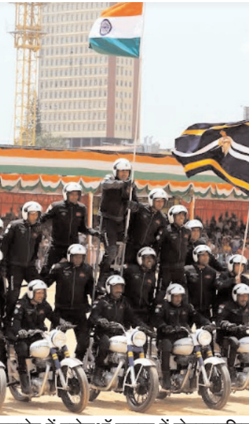
स्वतंत्रता दिवस समारोह में मानेकेशों ग्राउन्ड में मोटरसाइकिल पर करतब दिखाते हुए एएससी व एमईजी के जवान।

हजार करोड़ रुपये मिल रहे हैं। अगर हमें वह मिलता है, जिसके हम स्वाभाविक रूप से हकदार हैं, तो कर्नाटक सबसे अमीर राज्य होगा। सिद्धरामैया ने कहा कि, इस चुनौतीपूर्ण स्थिति के बावजूद, हम वित्तीय अनुशासन का पालन कर रहे हैं। हम राज्य के व्यापक विकास के लिए प्रतिबद्ध हैं। सभी देशभक्त हमारे प्रयासों से अवगत हैं। कर्नाटक के लोग फूट डालो और राज करो की नीति के प्रयासों के खिलाफ खड़े हो गए हैं। 'सर्व समावेशी' हमारी नीति है और इसलिए लोगों ने हमें सत्ता के लिए चुना है। यह नए कर्नाटक विकास मॉडल को मजबूत करने का वादा है, जो समावेशी विकास सुनिश्चित करता है और सभी के विकास के लिए तरसता है। यह सबसे महत्वपूर्ण वादा है जो मैं स्वतंत्रता दिवस के अवसर पर करता हूँ। देश पिछले कुछ वर्षों में संकट का सामना कर रहा है। नफरत, हिंसा, संदेह, बदला और असहिष्णुता बढ़ रही है। बल्कि, इन