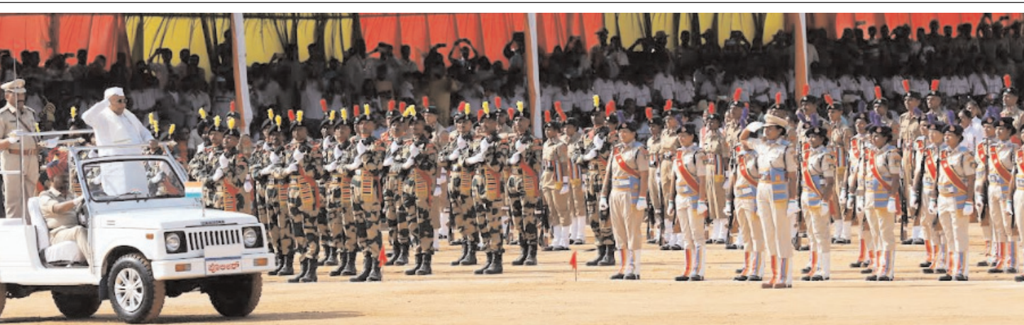
बंगलूरु के फील्ड मार्शल मानेकेशों ग्राउन्ड में परेड की सलामी लेते हुए मुख्यमंत्री।