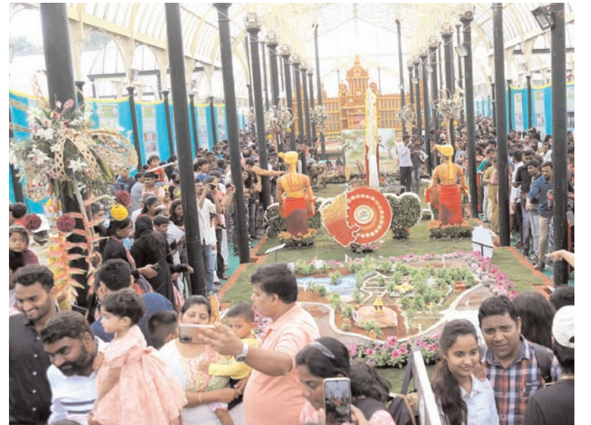
रविवार को बंगलूरु के लालबाग स्थित ग्लास हाउस में चल रही स्वतंत्रता दिवस पुष्प शो में सप्ताहांत की भीड़ देखी गई।