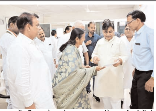
जयपुर में रविवार को अपने आवास पर कांग्रेस कार्यकर्ताओं से मुलाक़ात करते प्रदेश कांग्रेस अध्यक्ष गोविंद सिंह डोटसारा।

सिरोंही। राजस्थान के सिरोंही के मांडानी गांव में करंट लगने से एक बंदर की मौत हो गई। जिसके बाद ग्रामीणों ने एक अनोखे अंदाज में पौराणिक परंपरा के अनुसार बंदर की शवयात्रा निकाली। उसके बाद हिंदू रीति-रिवाज से बंदर का नदी किनारे अंतिम संस्कार किया गया। स्थानीय लोगों के मुताबिक गांव में ही करंट लगने से एक बंदर की मौत हो गई थी। इसकी सूचना मिलने के गांव के लोगों ने घटनास्थल पर पहुंचकर पूरे धार्मिक रीति-रिवाजों के साथ बंदर की पूरे गांव में शवयात्रा निकाली। और उसके बाद नदी के किनारे अंतिम संस्कार किया गया। बता दें, कि स्थानीय निवासी बंदर और लंगूरों को भगवान हनुमान का प्रतिरूप मानकर पूजा करते हैं। भगवान राम के समय से ही वानरों को पूजा जाता है। इसलिए ग्रामीण पौराणिक परंपरा का आज तक निर्वहन करते आ रहे हैं। गांव के हर इलाके में बंदरों का वास है। परेशान के करने के बावजूद यहां के लोग बंदरों को बर्दाश्त करते हैं।