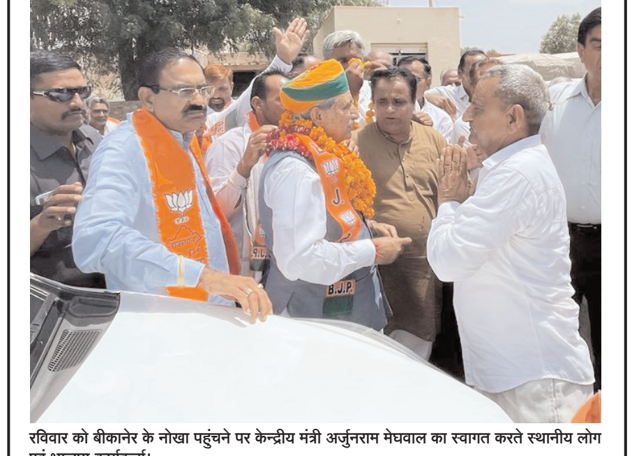
रविवार को बीकानेर के नोखा पहुंचने पर केन्द्रीय मंत्री अर्जुनराम मेघवाल का स्वागत करते स्थानीय लोग एवं भाजपा कार्यकर्ता।