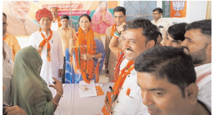
भीलवाड़ा जिले के शंभुगढ़ में रविवार को भाजपा प्रदेश महामंत्री एवं राजसमंद सांसद श्रीमती दिया कुमारी आरसीए विधानसभा क्षेत्र की बूथ विजय संकल्प बैठक को संबोधित करती हुई।