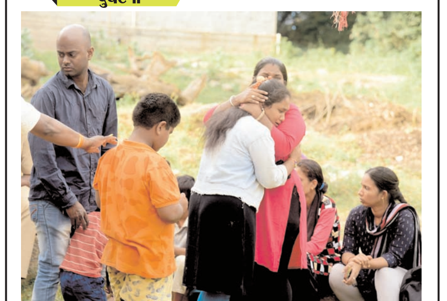
रविवार को तुमकुरु के सिद्धांगा मठ में गोकृष्ण में मां समेत चार लोग डूब गए। यह घटना तब हुई जब उन्होंने गोकाट तालाब में गिरे एक लड़के को बचाने की कोशिश की।