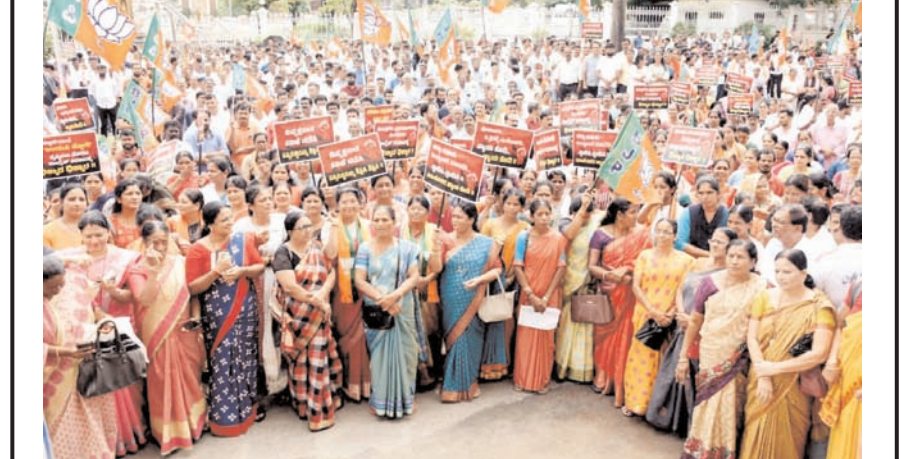
उडुपी में निजी कॉलेज के शौचालय में निजी वीडियो की कथित रिकॉर्डिंग की निंदा करते हुए भाजपा कार्यकर्ताओं ने सोमवार को मंगलूरु में विरोध प्रदर्शन किया और इस संबंध में विस्तृत जांच का आग्रह किया।