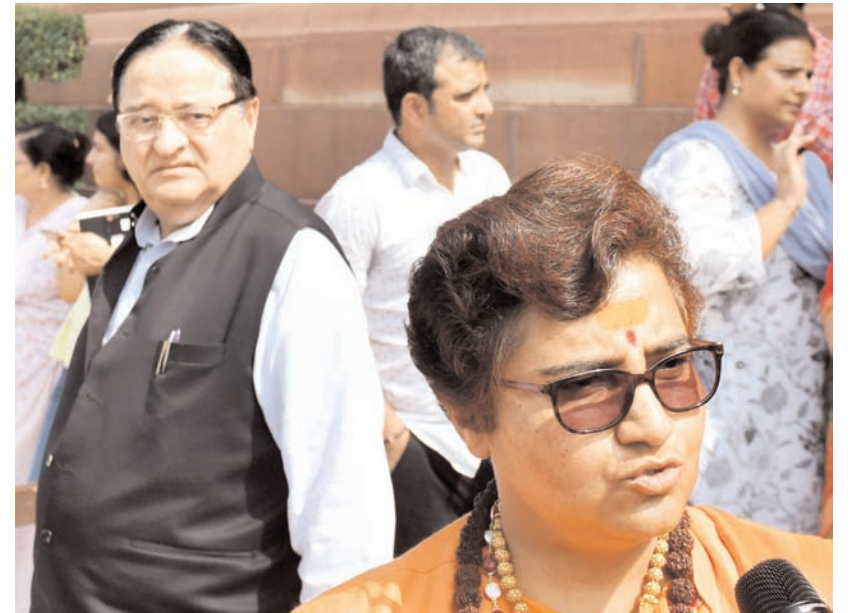
भाजपा सांसद प्रजा सिंह ठाकुर सोमवार को नई दिल्ली में मानसून सत्र के दौरान संसद भवन जाती हुई।