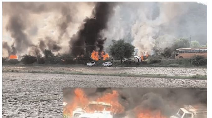
निकटवर्ती गुरुग्राम जिले के सोहनना में मुस्लिम समुदाय के लोगों की भीड़ ने चार वाहनों और एक दुकान को आग लगा दी।

सोशल मीडिया पर पोस्ट किया गया एक आपत्तिजनक वीडियो झड़प की वजह बना। ऐसी भी खबरें थीं कि राजस्थान में दो मुस्लिम व्यक्तियों की हत्या में वांछित गोरक्षक मोनू मानेसर को जुलूस में शामिल होना था। मानेसर ने 'पीटीआई-भाषा' को बताया कि उन्होंने विहिप की सलाह पर जुलूस में भाग नहीं लिया, क्योंकि उन्हें डर था कि उनकी