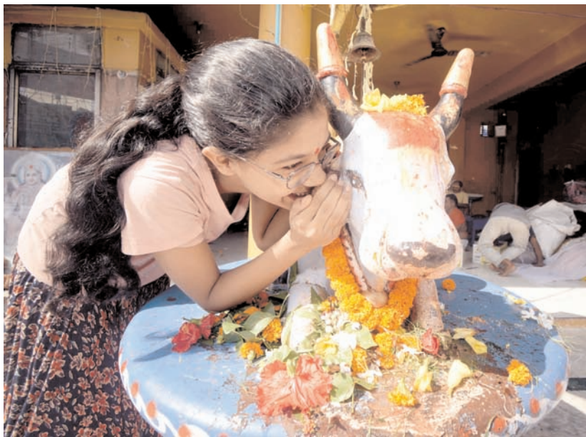
सोमवार को पटना के एक मंदिर में एक भक्त श्रावण के पवित्र महीने के दौरान अपनी इच्छाओं की पूर्ति के लिए 'नंदी' के कानों में फुसफुसाती हुई।